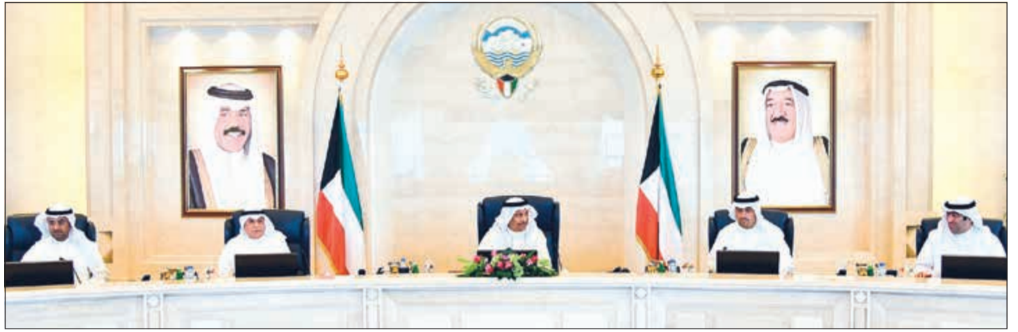
سمو الشيخ جابر المبارك مترئسا الاجتماع بحضور الشيخ خالد الجراح وأنس الصالح ود.نايف الحجرف وخالد الروضان

المجلس اطلع على ملاحظات ومقترحات لجنة الشؤون الاقتصادية لمعالجة أوجه الخلل والسلبيات القائمة في الأجهزة الحكومية