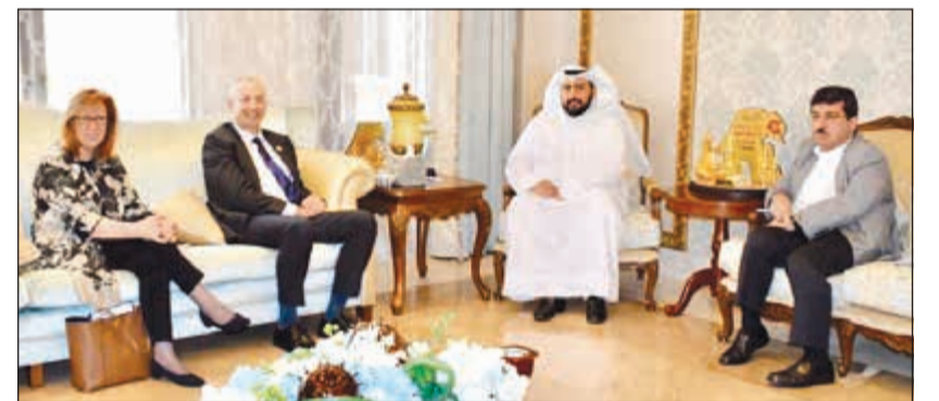
الشيخ د.باسل الصباح مستقبلاً البارونة باتريشيا موريس والسفير البريطاني مايكل دافنبورت

استقبل وزير الصحة الشيخ د.باسل الصباح في مكتبه امس البارونة باتريشيا موريس برفقة السفير البريطاني لدى الكويت مايكل دافنبورت. وقد استعرض الجانبان خلال اللقاء علاقات التعاون التي تربط الكويت وبريطانيا في مختلف المجالات الصحية. وقد أمنت البارونة موريس على الإنجازات التي تمت في المجال الصحي من خلال اجتماعات اللجنة الكويتية - البريطانية المشتركة التي تعقد اجتماعاتها بشكل دوري. وتناول اللقاء عرض ومناقشة عدة محاور لدعم وتعزيز التعاون والشراكة مع وزارة الصحة والمستشفيات البريطانية لتوفير الرعاية للاستفادة من الخبرات الطبية لتطوير الرعاية الصحية الشاملة في الكويت.