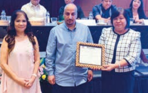
تكريم رئيس الاتحاد خالد الدخنان على هامش الاجتماع