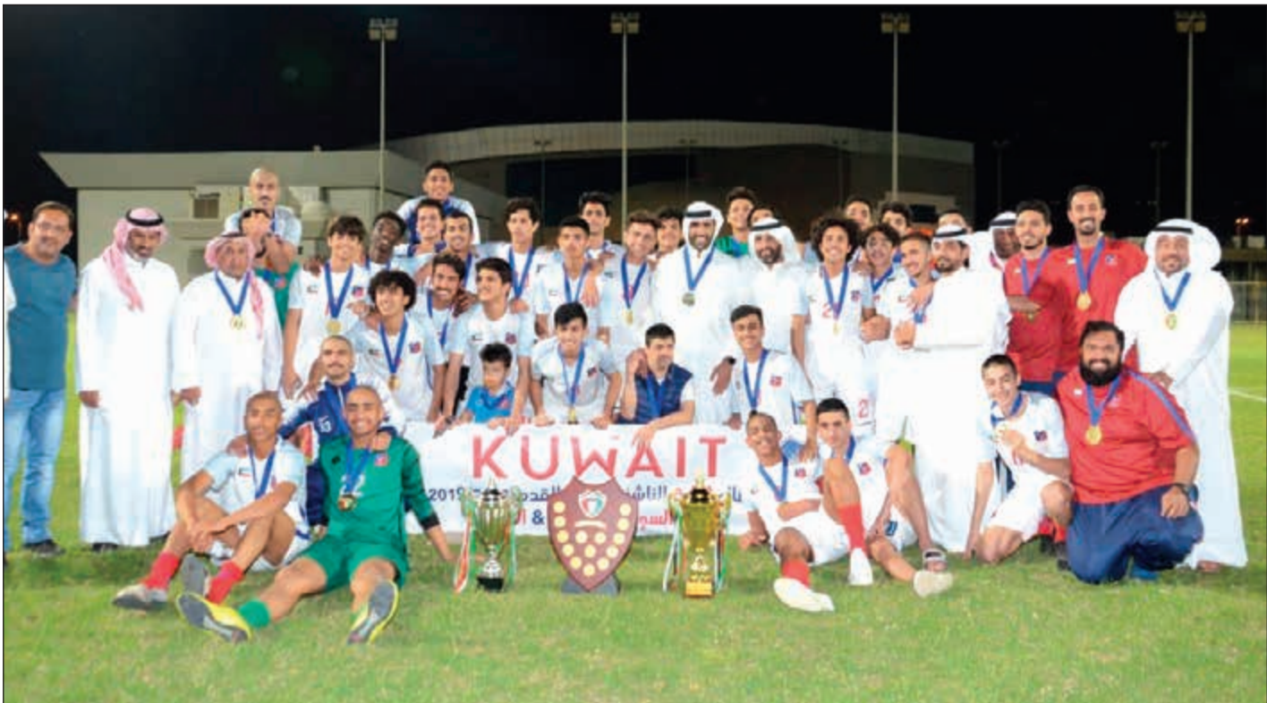
فريق الكويت للشباب تحت 20 سنة يستعد للحفاظ على إنجازاته