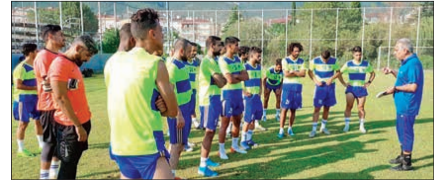
جانب من تدريبات فريق الشباب في معسكره بتركيا