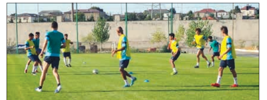
جانب من تدريبات الفحيحيل في معسكره الخارجي بأذربيجان