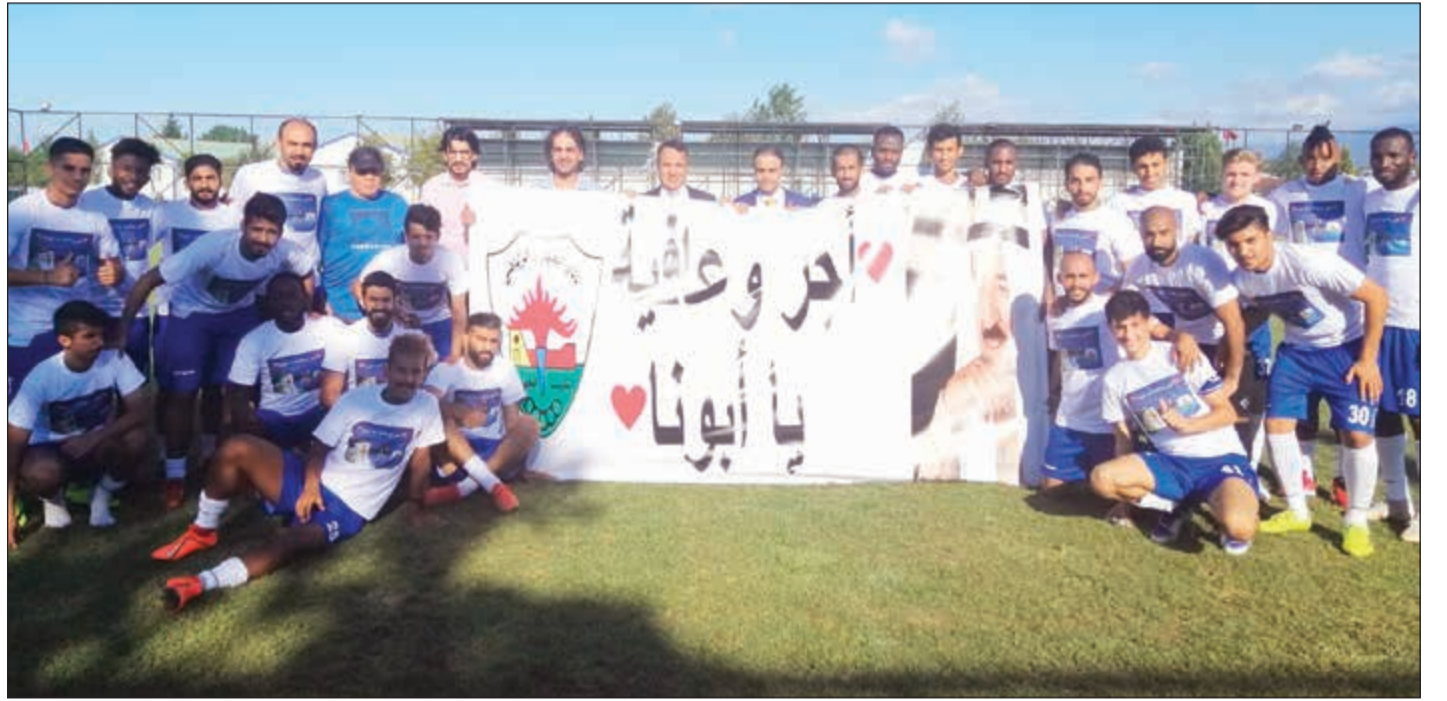
لاعب الجھراء يرفعون لوحة لصاحب السمو الأمير بعد أن من الله عليه بالشفاء