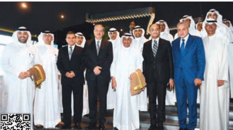
النائب العام المستشار ضرار العسوسى ونظيره المستشار نبيل صادق وعدد من المحامين العاملين في صورة جماعية على هامش حفل الغداء في أبراج الكويت أمس

■ تسليم الكويت للخلية الإرهابية يأتي ضمن التعاون القضائي القوي القائم بيننا