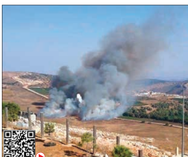
تدمور أمني على الحدود اللبنانية - الإسرائيلية أمس

ترجمت المخاوف من تحول التوتر المتصاعد بين حزب الله وإسرائيل منذ أيام، إلى مواجهة ميدانية مباشرة «محدودة»، وسط مساعٍ دولية لمنع تحولها إلى مواجهة أكبر. وأعلن الحزب أمس تدمير آلية عسكرية إسرائيلية قرب مستوطنة أفيغيم قرب الحدود الجنوبية للبنان، مؤكداً سقوط قتلى وجرحى. وريدت إسرائيل على صواريخ «الكورنيت» اللبنانية المضادة للدبابات باستهداف «خارج بلدات مارون الراس، عيترون، وبارون ياكتر من 40 قذيفة صاروخية عنقودية وحارقة، ما أدى إلى اندلاع حرائق». غير أن الاتصالات الدولية نجحت على ما يبدو في احتواء المواجهة، حيث قال الجيش الإسرائيلي «يبدو أن الاشتباك على الأرض قد انتهى لكن الموقف الاستراتيجي لا يزال قائماً وقوات الدفاع الإسرائيلية لا تزال في حالة تأهب قصوى».