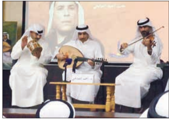
الفرقة الموسيقية خلال الأمسية