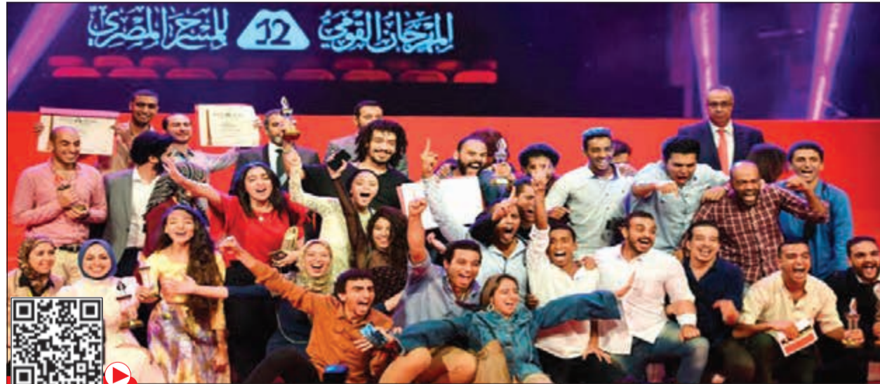
الفائزون بجوائز الدورة الـ12 في المهرجان القومي للمسرح المصري