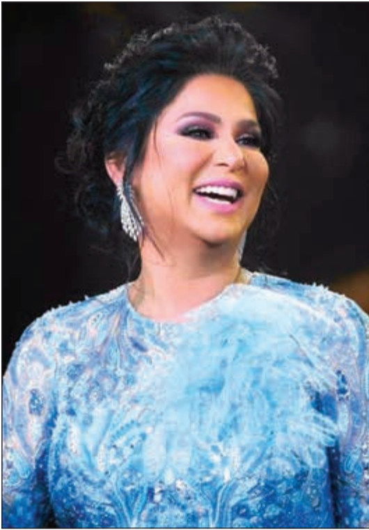
عبد الحميد الخطيب

«السودة رائعة، أنا تابعت حفلاتها كلها، الجمهور فيها حاضر، وحافظ، ورائع كالعادة»، بهذه الكلمات عبرت «القيثارة» نوال الكويتية عن سعادتها بالنجاح الكبير الذي حققه حفلها الذي أحيته مساء أمس الأول على خشبة مسرح طلال مداح في ختام حفلات موسم السودة بالشرقية في السعودية، وشاركها الحفل الفنان عبادي الجوهري.