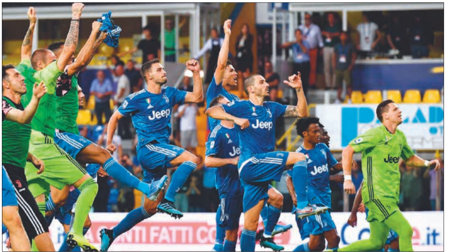
لاعبو يوفنتوس يسعون لتحقيق الفوز الثاني على حساب خصمهم نابولي غدا

يأمل المدرب ماوريتسيو ساري في التعافي من مرضه والتواجد على أرض الملعب، عندما يخوض فريقه الجديد يوفنتوس مباراته الأولى على أرضه ضد غريمه القوي نابولي، غدا السبت في المرحلة الثانية من الدوري الإيطالي. وكان ساري، العائد إلى إيطاليا بعد موسم صاخب مع تشلسي الإنجليزي، غاب عن الفوز الأول لحاصل اللقب في المواسم الثمانية الماضية بسبب التهاب رئوي، حيث تغلب «اليوفي» على بارما 0-1، وتشكل مباراة حامل اللقب ووصيفة قمة مبكرة في «سيري أ»، لكن الأ نظار ستركز على ساري (60 عاما) الذي جعل من نابولي قوة هجومية كبرى نافست على اللقب المحلي خلال إشرافه على الفريق الجنوبي قبل رحيله إلى لندن وقيادة «البولز» إلى لقب الدوري الأوروبي، لكن ساري