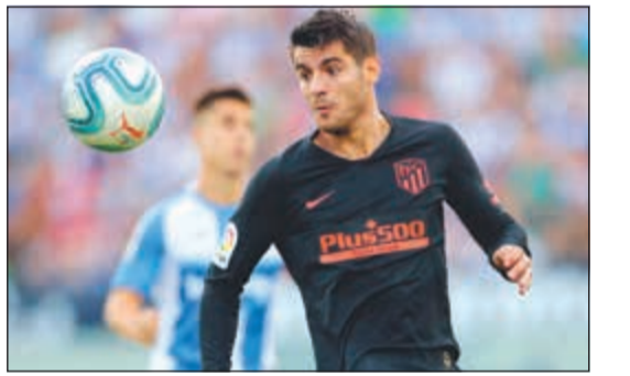
الفارو موراتا يعاني من التواء في مفاصل ركبته

يعاني المهاجم الدولي الإسباني الفارو موراتا من التواء في مفاصل ركبته، بحسب ما أعلن فريقه أتلتيكو مدريد، وسيغيب على الأرجح عن المباريات المقبلة في «الليغا» ولمنتخب إسبانيا مطلع سبتمبر المقبل. وأصيب موراتا الأربعاء في التمارين ويعاني من التواء في «مرحلة معتدلة»، بحسب ما أوضح فريق العاصمة الذي حقق انتصارين من مباراتين في الدوري المحلي. وسيغيب لاعب تشلسي الإنجليزي ويوفنتوس الإيطالي وريال مدريد السابق عن مواجهة أيبار ضمن المرحلة الثالثة بعد غد الأحد، ومواجهتي المنتخب الإسباني ضد رومانيا وجزر فارو في تصفيات كأس أوروبا 2020 في 5 و8 سبتمبر.