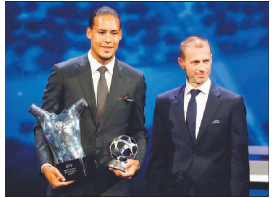
الهولندي فيرجيل فان دايك مع جائزتي أفضل مدافع وأفضل لاعب في أوروبا