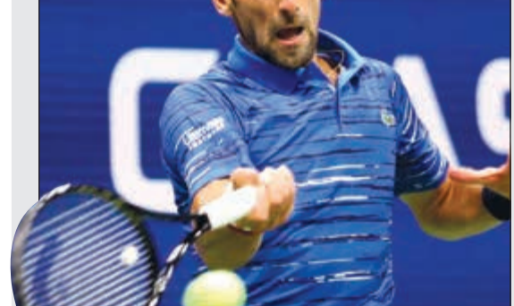
نوفاك ديوكوفيتش يبريد الاستفادة من الراحة

فيدرر للدور المقبل، بعدما اجتاز عقبة البوسني دامير جومهور بـ3 مجموعات لجموعه واحدة. وقلب فيدرر خسارته للمجموعة الأولى بنتيجة 6-3، بعدما فاز بالمجموعات الثلاث الأخيرة بنتيجة 2-6 و3-6 و4-6، ويلتقي فيدرر في الدور الثالث مع الفائز من مباراة البريطاني دانييل إيفانز والفرنسي لوكاس بويلي. وتآجت مباريات كثيرة بسبب الأمطار التي هطلت على نيويورك، وأقيمت فقط اللعائن المقررة على ملعب «أرثر اش» و«لويس أرمسترونغ» لأنهما يملكان سقفين يمكن إقفالهما. في المقابل، تخطت الأميركية سيرينا وليامس خسارتها المجموعة الأولى أمام الأميركية كاترين ماكنالي 7-5 لتفوز