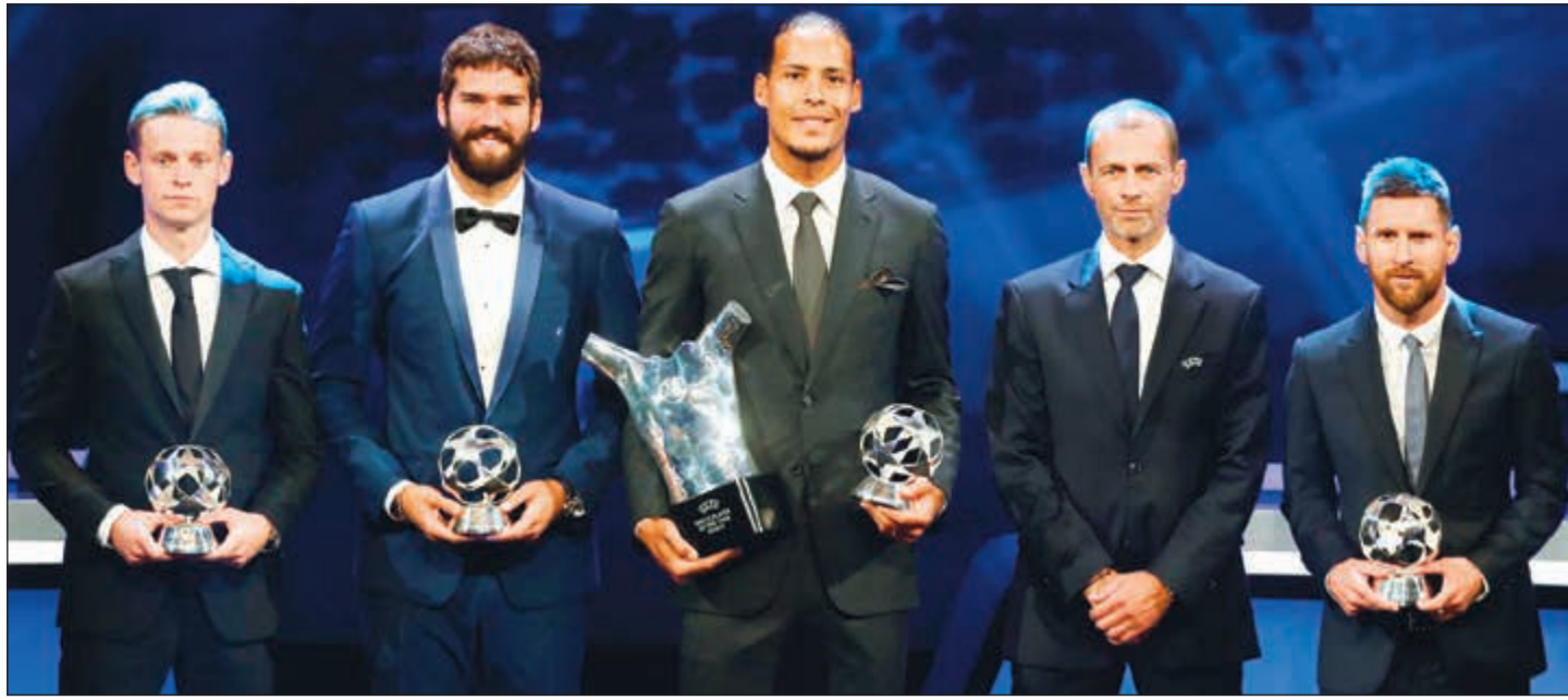
لقطة جماعية للفائزين بجوائز أفضل في دوري أبطال أوروبا للموسم الماضي