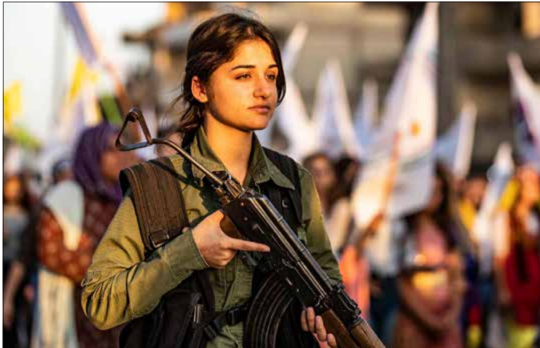
عصر من قوات الأمن الكردية «الاسايش» تحرس مظاهرة ضد تركيا في القامشلي

ونقلت وكالة «الأنابول» الرسمية التركية عن مصدر أمني أن «ما تداولته صفحات التواصل الاجتماعي والمواقع