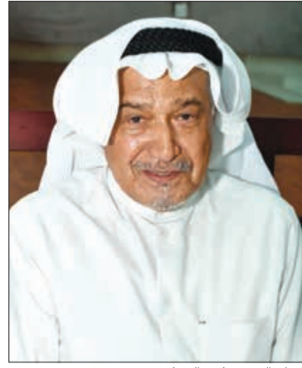
الفنان جاسم النهان