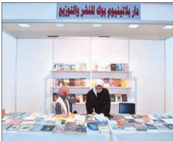
جناح دار بلاتينيوم بوك للنشر والتوزيع