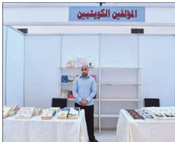
جناح «المؤلفين الكويتيين»