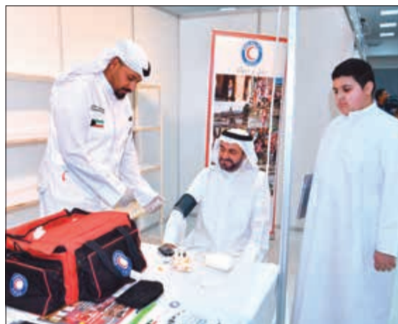
فحوصات طبية في جناح جمعية الهلال الأحمر