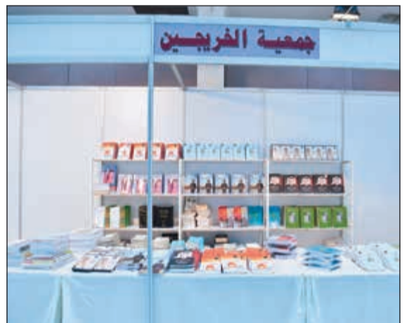
جناح جمعية الخريجين

تحدث عن تفاصيله خلال جلسة حوارية عقدت ضمن الفعاليات المصاحبة لمعرض الكتاب الصيفي