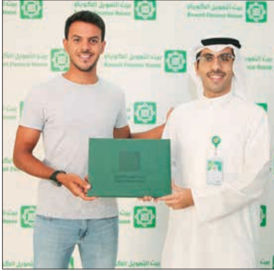
الإعلان عن الشراكة الاستراتيجية

«بيتك» البنك الوحيد الذي أطلق برنامج «أنتم فخرنا» وضم فريق «مبادري»