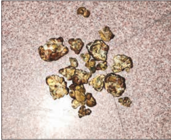
الكوكايين المضبوط مع مواطن قادم من إحدى الدول الأوروبية