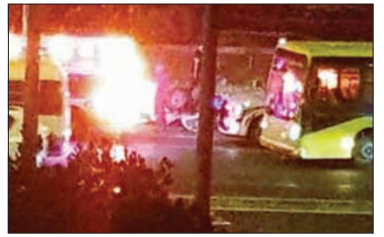
المركبة أثناء انقلابها على طريق الفحيحيل السريع