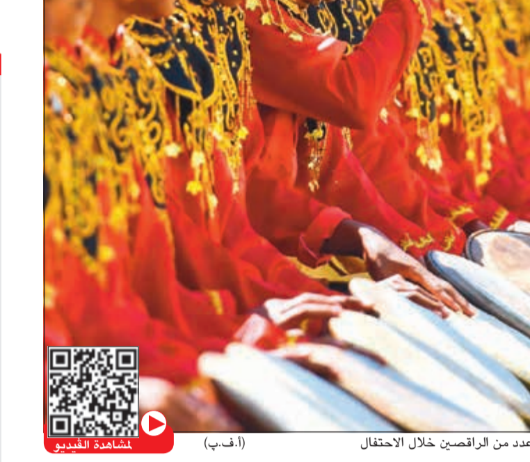
عدد من الراقصين خلال الاحتفال