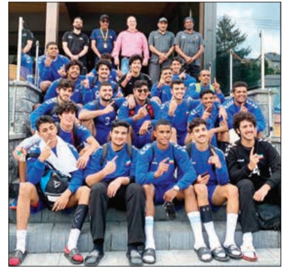
منتخب شباب اليد