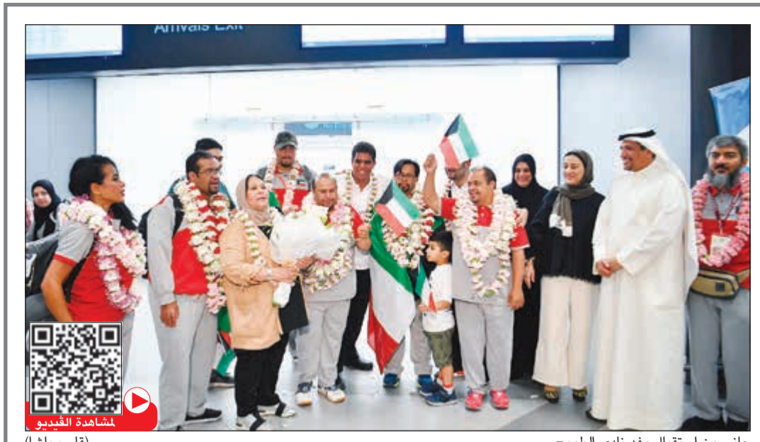
جانب من استقبال وفد نادي الطموح