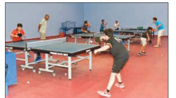
استعدادات منتخب الطاولة للاستحقاقات المقبلة