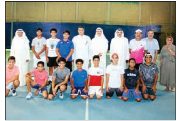
الشيخ أحمد الجابر مع وفد اللاعبين قبل مغادرتهم إلى إسبانيا