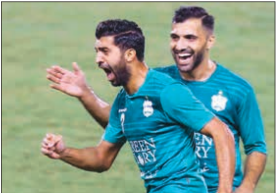
معزز باله الجديدي مثار أزمة بين ناديي النجمة والآنصار