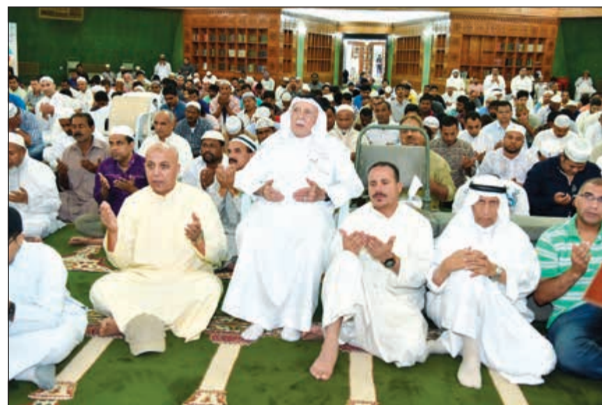
دعاء وتبئيل خلال صلاة العيد بمسجد فاطمة بمنطقة عبدالله السالم (ريليش كرمار)

اللله أكبر الله أكبر، لا إله إلا الله، الله أكبر الله أكبر والله الحمد. سنة مؤكدة فعن أنس رضي الله عنه قال: «ضحى النبي ﷺ بكبشين أملحين أقرنين، ذبحهما بيده، وسمى وكبر، ووضع رجله على