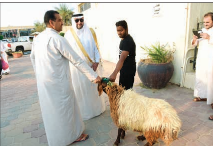
ذبح الأضحية سنة مؤكدة

اللله أكبر الله أكبر الله أكبر، لا إله إلا الله، الله أكبر الله أكبر والله الحمد. اللهم صل وسلم وبارك على عبدك ورسولك محمد، وارضى اللهم عن الخلفاء الراشدين والأئمة المهديين: أبي بكر وعمر وعثمان وعلي، وعن سائر الصحابة أجمعين، اللهم سلم الحجاج والمعتمرين، وردداهم إلى أهلهم سالمين غانمين. اللهم اغفر للمسلمين والمسلمات، والمؤمنين والمؤمنات، الأحياء منهم والأموات. اللهم وفق أمير البلاد وولي عهده ولاة أمور المسلمين لما تحب وترضى، وخذ بنواصيرهم للبر والتقوى، وهب لهم البطانة الصالحة الناصحة التي تدلهم على الخير وتعينهم عليه، واجعل بلادنا بلاد أمن وأمان، ورخاء وسعة رزق، واصرف عنها الشرور والفتن، ما ظهر منها وما بطن.