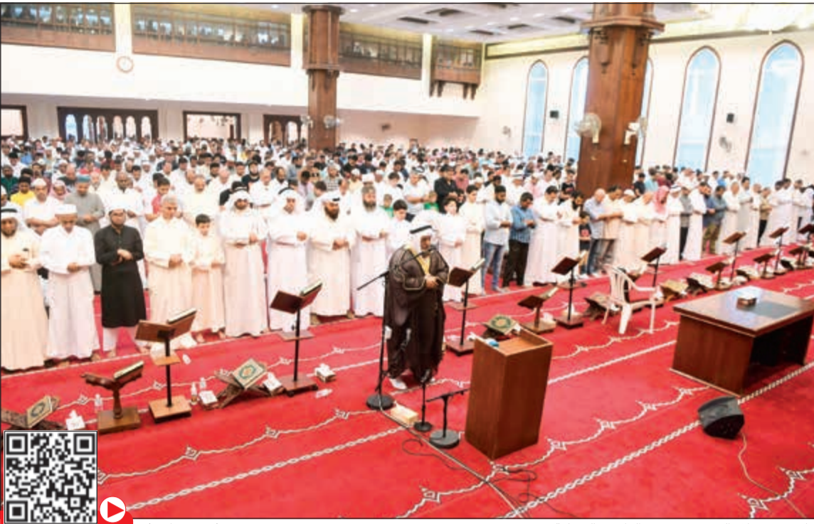
جانب من صلاة العيد في مسجد الراشد بالعدلية (محمد هاشم)