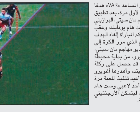
ألفت تقنية الحكم الفيديو المساعد «VAR» هدفا في الدوري الإنجليزي الممتاز لأول مرة، بعد تطبيق التجربة هذا الموسم، وهزم مهاجم مان سيتي، البرازيلي غابرييل جيسوس، شباك وست هام يونايتد، وعقب العودة لتقنية الفيديو قرر حكم المباراة إلغاء الهدف بداعي تسلل رحيم ستيرلينغ الذي مرر الكرة إلى جيسوس. وأنقذت تقنية الفيديو مهاجم مان سيتي، الأرجنتيني سيرجيو أغويرو، من بداية محببة بالدوري. وكان «السيتي» قد حصل على ركلة جزاء أمام وست هام يونايتد، وأهدرها أغويرو ولكن بالعودة لتقنية الفيديو أعيد تنفيذ للعبة مرة أخرى، بعد التأكد من دخول أحد لاعبي وست هام منطقة الجزاء قبل التسديد، ليتمكن الأرجنتيني من تسجيلها في المرة الثانية.

حقق مان سيتي بداية ساحقة في بداية حملته للدفاع عن لقب الدوري الإنجليزي الممتاز لكرة القدم الذي أحرزه في الموسم الماضي، بفوزه 5-0 بينها «هاتريك» رحيم ستيرلينغ، على مضيفه وست هام يونايتد أمس. وأتت أهداف «السيتي» عبر البرازيلي غابريال جيزوس (25)، وستيرلينغ (51 و75 و90+1)، والأرجنتيني سيرخيو أغويرو من ركلة جزاء (86).