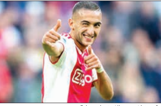
حكيم زياش يريد الاستمرار مع اياكس

أعلن نادي اياكس أمستردام عن تمديد عقد لاعب وسطه الدولي المغربي حكيم زياش لعام إضافي حتى 2022، وأضعا بذلك حداً للحديث عن إمكانية رحيله عن بطل الدوري الهولندي. ويشكل بقاء المغربي البالغ من العمر 26 عاماً خبراً ساراً لجمهور «كبير هولندا»، لاسيما بعد أن خسر الفريق جهود نجميه الآخرين ماتيس دي لخت وفركي دي بونغ لصالح يوفنتوس الإيطالي وبرشلونة الإسباني تواليها. وارتبط اسم زياش هذا الصيف بانتقال محتمل إلى الدوري الإنجليزي للدفاع عن ألوان ليفربول أو أرسنال.