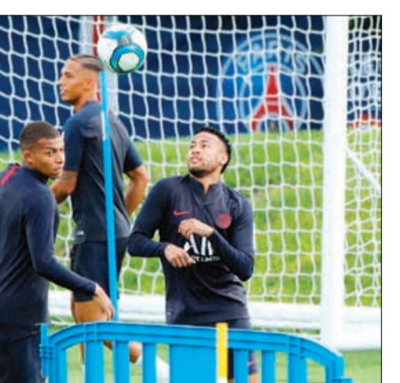
نيمار في تدريبات باريس سان جرمان الأخيرة

افتتح ليون الموسم الجديد من الدوري الفرنسي بفوزه 3-0 على مضيفه موناكو وصيف بطل الموسم قبل الماضي، مستغلاً النقص العددي في صفوف الأخير بعد طرد الإسباني سيسك فابريغاس بالدقيقة 27 في قمة مباريات المرحلة الأولى. وسجل ثلاثية ليون كل من موسى ديمبيلي (5)، والهولندي ميفيس ديياي (36)، ولوكاس توارت (80). وتختتم المرحلة اليوم بقاءات وصيف البطل الموسم الماضي ليل مع نانت، وحامل اللقب باريس سان جرمان مع نيم، وستراسبورغ مع متز. وأقاد مسؤول في نادي باريس سان جرمان بأن النجم البرازيلي نيمار سيغيب عن تشكيلته أمام نيم، مؤكداً وجود مفاوضات