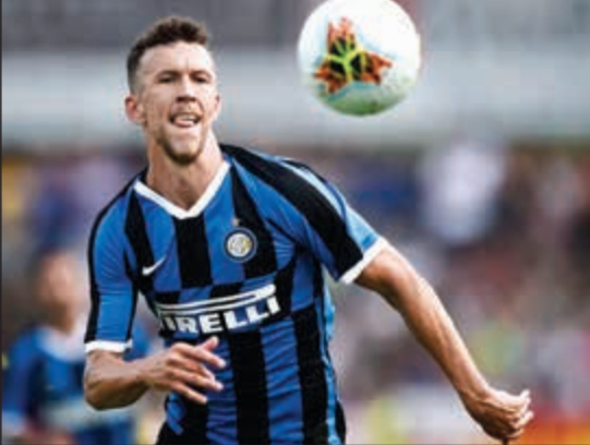
إيفان بيريسيتش بحاجة لتجربة جديدة في مسيرته

ذكرت تقارير إعلامية إيطالية أن المهاجم الكرواتي إيفان بيريسيتش بات قريباً من انضمامه لصفوف بايرن ميونيخ، بطل الدوري الألماني لكرة القدم، قادماً من نادي إنتر ميلان. وذكرت صحيفة «لاغازيتا ديللو سبورت» الإيطالية أمس أن بيريسيتش (30 عاماً)، الذي لعب من قبل في ألمانيا مع بوروسيا دورتموند وفولفسبورغ، لم يتواجد في قائمة «الإنتر» التي ستواجه فالنسيا في مباراة ودية. ويمكن أن ينتقل بيريسيتش في البداية معارياً لبايرن ميونيخ، الذي سيضع خيار شراء اللاعب بعد نهاية فترة الإدارة مقابل 25 مليون يورو. ويات يتعن على بايرن ميونيخ أن يتأقلم مع سوق الانتقالات بعدما تعرض لاتحاد كرة القدم الإنجليزي.