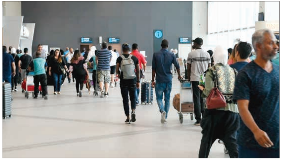
جانب من الزحام في مبنى 14

دبي ولندن وتركيا والقاهرة ومشهد أكثر الوجهات سفراً.. ومسافرون لـ «الأنباء»: نبحت عن «الوناسة»