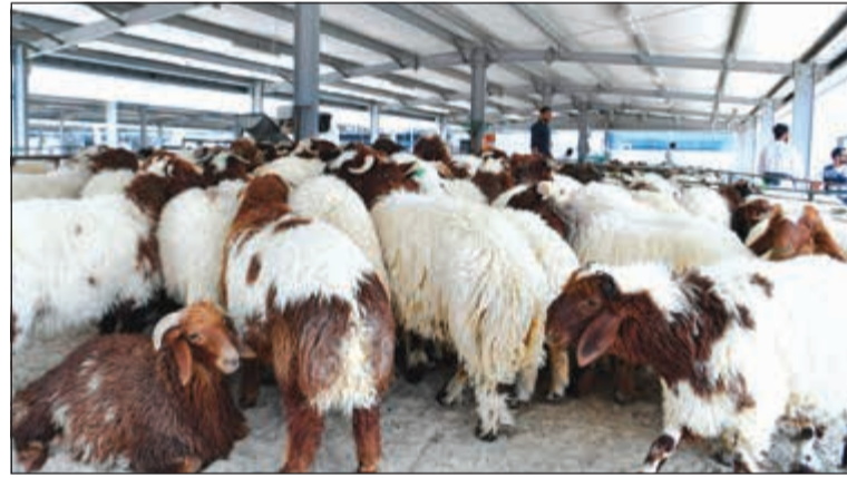
أسعار الأضاحي طبيعية وأنواعها متوافرة