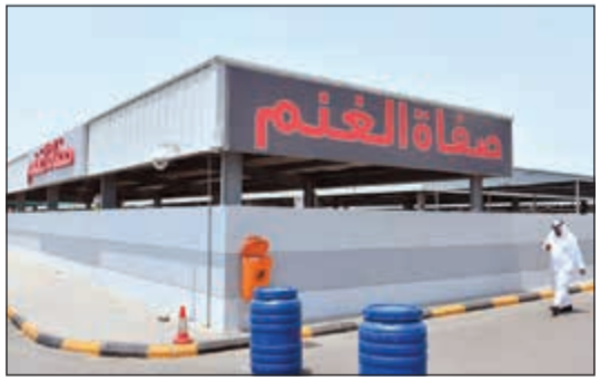
سوق صفاة الغنم بمنطقة الري (قاسم باشا)