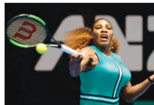
سيرينا وليامز الأولى في القائمة

صنفت مجلة «فوربس» الأميركية نجمة التنس الأميركية سيرينا وليامز الرياضية الأعلى دخلاً في العالم لعام 2019 بحسب التصنيف السنوي الذي نشرته، وكشفت مجلة الأميركية أن سيرينا الفائزة بـ 23 لقباً كبيراً حصدت 29.2 مليون دولار على مدى 12 شهراً حتى الأول من يونيو بينها 4.2 ملايين دولار كجوائز مالية. وحلت ثانية اليابانية ناومي أوساكا التي برزت في الأضواء عام 2018 عندما تغلبت على سيرينا بالذات في نهائي فلاشينغ ميدوز، مع 24.3 مليون دولار، وثالثة الأميركية انجيليك كيرير مع 11.8 مليون دولار أمام الرومانية سيمونا هاليب في المركز