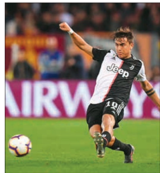
ديبالا أمام تجربة جديدة في الدوري الإنجليزي

كشفت تقارير إعلامية عن اقتراب الأرجنتيني بولو ديبالا لاعب نادي يوفنتوس الإيطالي لكرة القدم، من الانتقال إلى توتنهام الإنجليزي خلال فترة الانتقالات الصيفية الجارية، وذكرت شبكة «سكاى» أن توتنهام وافق على دفع مبلغ 64.4 مليون جنيه إسترليني لضم ديبالا (25 عاماً) إلى صفوفه. وكان ديبالا قريباً من الانتقال إلى مانشستر يونايتد الإنجليزي في صفقة تبادل، يرحل على أثرها روميلو لوكاتو إلى يوفنتوس، لكن النادييين لم يتوصلا إلى اتفاق. وانضم ديبالا إلى يوفنتوس قادماً من باليرمو في 2015، حيث شارك في 182 مباراة مع الفريق في كل البطولات وسجل 78 هدفاً.