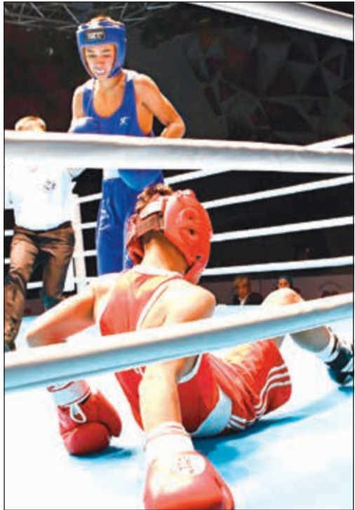
ملاكمو كازاخستان سجلوا حضوراً متميزاً في البطولة الآسيوية