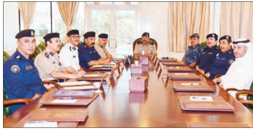
الفريق الشيخ فيصل النواف مترسلاً الاجتماع مع القيادات الأمنية الميدانية

وأختتم الفريق النواف متوجهاً بعدد من الملاحظات والتوجيهات للقيادات الأمنية لتوفير جميع عوامل الأمن والسلامة للمواطنين والمقيمين في جميع محافظات البلاد، مهنئاً إياهم بعيد الأضحى المبارك، داعياً الله أن يعيد هذه المناسبة المباركة على وطننا العزيز بالخير واليمن والبركات في ظل قيادتنا الرشيدة العليا.