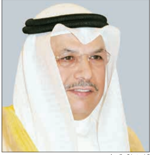
الشيخ خالد الجراح

في توجيهات ولقطة إنسانية من نائب رئيس مجلس الوزراء ووزير الداخلية الشيخ خالد الجراح وبمناسبة قدوم عيد الأضحى المبارك، أصدرت وزارة الداخلية قراراً بالإفراج عن جميع أعضاء قوة الشرطة الموقوفين انضباطياً اعتباراً من اليوم السابق ليوم وقفة عرفات. من جهة أخرى، أعلنت الإدارة العامة لمراكز الخدمة عن إيقاف العمل في مراكز الخدمة بعطلة نهاية الأسبوع حتى يوم السبت الموافق 2019/8/10 وذلك بمناسبة عيد الأضحى المبارك.