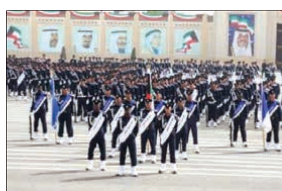
صورة ارشيفية لحفل تخريج رقباء أوائل

الحكم عليه في جنابة أو جنحة مخلة بالشرف والأمانة. 2 - أن يكون محمود السيرة حسن السمعة. 3 - ألا يكون قد سبق