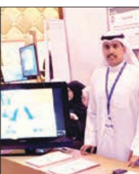
طالبان من «الهندسة» خلال عرض المشروع

توفير الطاقة بجهاز ميكانيكي لتقليل العنصر البشري، حيث إنه مصنوع بطريقة تجعله قابلاً للتعديل بين نوعين من العجلات: الأول للمشي بحرية على الأرض، والثاني للصعود على الدرج وتخطي العقبات، ويمكن الاستفادة منه في جميع المجالات الطبية خاصة الطوارئ.