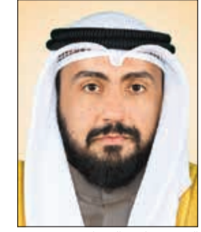
الشيخ دباسل الصباح