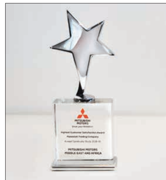
أفضل جائزة لإرضاء العملاء في الكويت

وفقاً للدراسة، يقدر أصحاب المركبات والخدمات الشخصية التي تصمم لراحتهم وتعزز تجربتهم وتم تقديم الجائزة لممثل شركة المسيلة التجارية في الكويت من قبل مدير