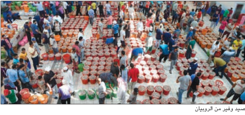
صيد وفير من الروبيان

«الأنباء» استطلعت مزاد الأسماك أمس في سوق السمك، حيث قال رئيس الاتحاد الكويتي لصيادي الأسماك ظاهر الصويان إن أسماك الميـد موجودة في جون الكويت وهو مكان محظور الصيد، مشيراً إلى أن أكثر من 15 طراد صيد مجوزاً بسبب الصيد في جون الكويت وإن الأماكن التي يسمح الصيد فيها هي فيلكا من ناحية الشرق ولا يوجد فيها سمك الميـد. وأضاف الصويان أنه في