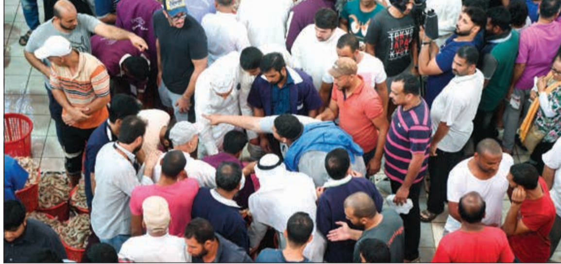
المزاد في سوق السمك

عاطف رمضان - محمد راتب شهد مزاد سوق السمك أمس وجود 695 سلة ربيان، منها 569 سلة ربيان أم نعيـرة و126 سلة شحامية، بأسعار من 56 ديناراً إلى 65 ديناراً لسلة ربيان أم نعيـرة وتراوح سعر سلة ربيان الشحامية من 25 ديناراً إلى 28 ديناراً. أما سمك الميـد فقد شهد السوق كميات قليلة منه تقدر بـ 5 أو 6 سلات تقريبا بسعر يقارب 88 ديناراً للسلة الواحدة.