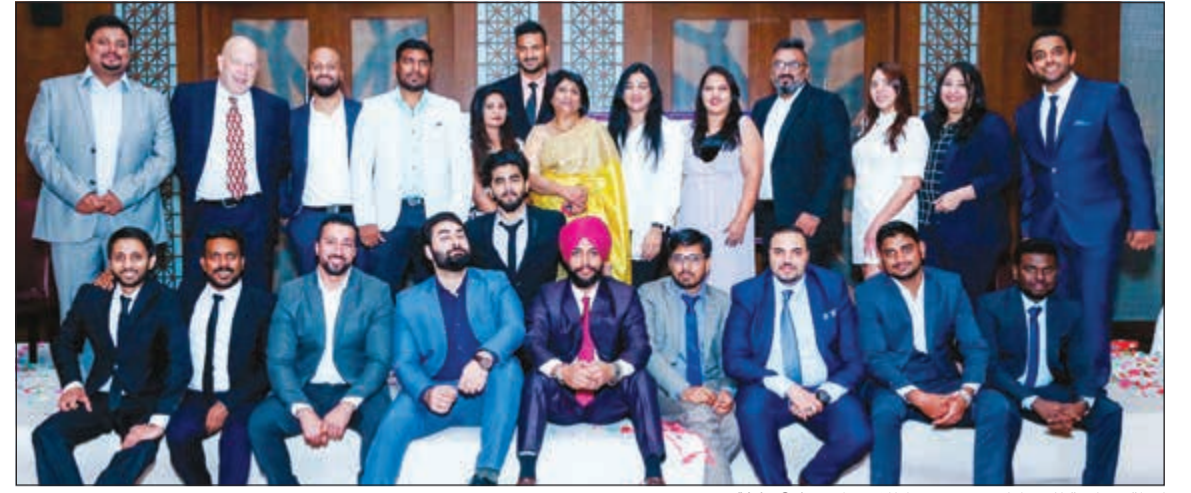
لقطة جماعية للمشاركين في حفل اطلاق تطبيق (Yala Go)

أعلن تطبيق «Yala Go» أحد المشاركين الجدد في سوق السيارات الأجرة، عن إطلاق خدماته في الكويت اليوم. وقال الرئيس التنفيذي لشركة «Yala Go»، جومانيوز إن التطبيق الجديد عبر الإنترنت يقوم بتجميع طلب العملاء والسائقين في مكان واحد في السوق. وكشف عن وجود أسطول من 1000 سيارة أجرة وهذا الأسطول في تزايد، مع سائقين محترفين ومدربين جيدين. وأضاف «إلى جانب جعلها واحدة من خدمات سيارات