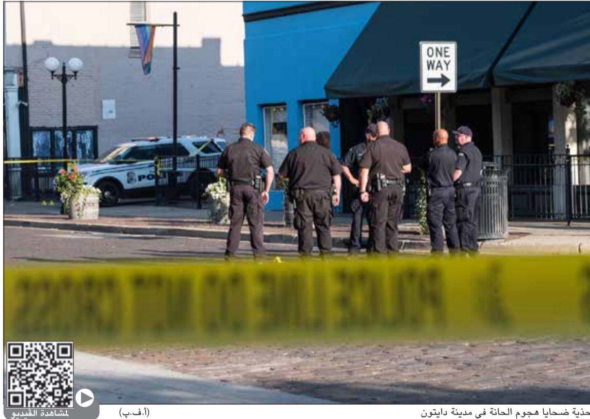
أحد ضحايا هجوم الحانة في مدينة دايتون

ونشرت صحيفة دايتون ديلي نيوز أن إطلاق النار وقع في حانة تعرف باسم (نيو