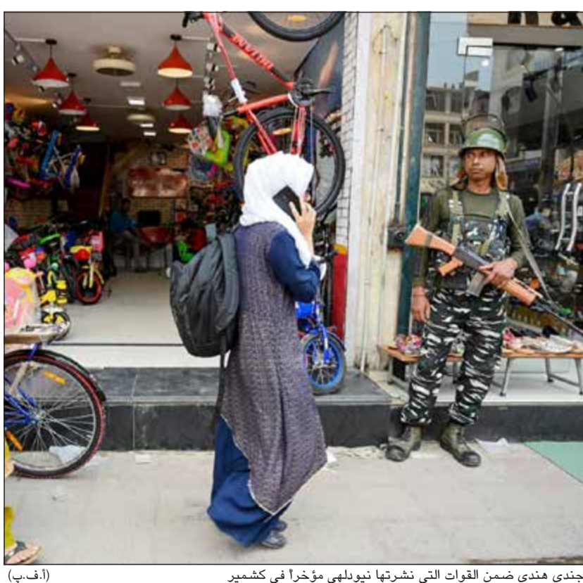
جندي هندي ضمن القوات التي نشرتها نيودلهي مؤخرا في كشمير

ويسارع آلاف السياح والطلاب إلى مغادرة كشمير منذ إعلان حكومة ولاية جامو وكشمير مؤخرا أن عليهم المغادرة «فورا» وسط معلومات استخباراتية جديدة تتعلق بـ«تهديدات إرهابية» لموسم حج هندوسي كبير في المنطقة، وأصدرت بريطانيا والمانيا تحذيرات من السفر إلى المنطقة.