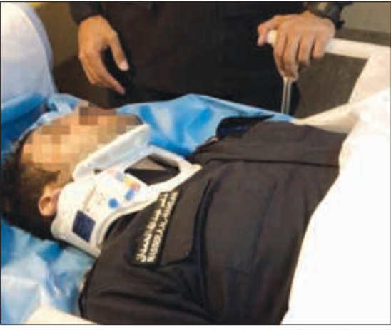
العريف المجني عليه خلال تلقيه العلاج

خيطان تم الاشتباه في مركبة مخالفة وبها شخصان وحين استيقافها وطلب الأوراق الثبوتية وتفتيش المركبة احترازا تبين أن بحوزتهما سيجارة يشتبه بها مادة مخدرة وأدوات تعاط، وبالتدقيق عليهما امتصا تبين أن قائد المركبة مواطن من مواليد 1985 ومرافقه مواطن من مواليد 1979 مطلوب مدنيا وأثناء اتخاذ إجراءات التحفظ عليهما قاما بالاعتداء على قائد الدورية واحدهما به إصابة بالرأس، وتم طلب الإسناد اللازم وتمكنت القوة الأمنية من التحفظ عليهما وطلب الإسعاف ونقل قائد الدورية المصاب إلى مستشفى الفروانية وجر عمل الفحوصات الطبية اللازمة له، وتمت إحالة المواطنين إلى الجهات المختصة لاتخاذ الإجراءات القانونية بحقهما.