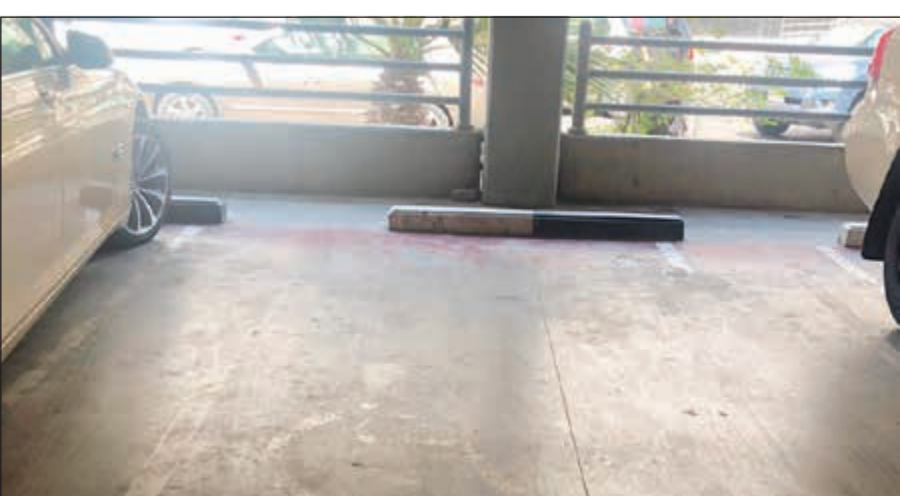
علامة المعاقين تكاد تكون غير واضحة للمراجعين