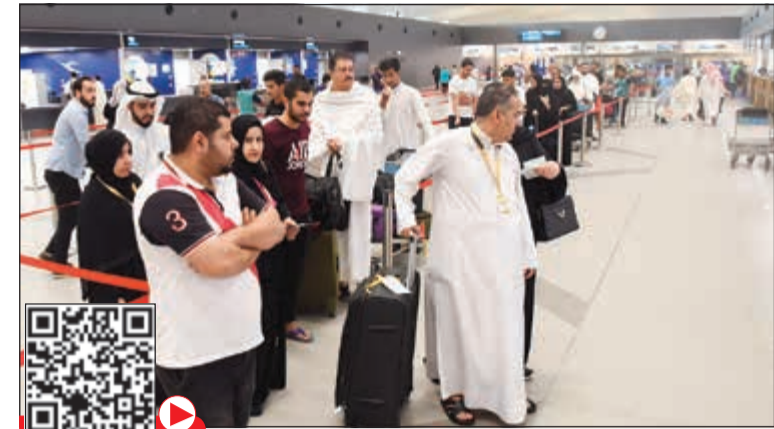
انسيابية في حركة الحجاج المسافرين لأداء مناسك الحج

إجمالي عدد الحجاج الذين سيفادرون 6822 حاجاً وفقاً للرحلات المجدولة