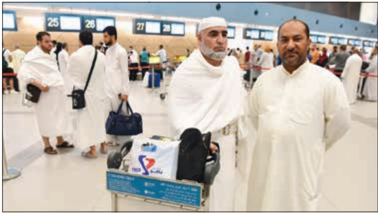
جانب من مغادرة الحجاج إلى الديار المقدسة (أحمد علي)