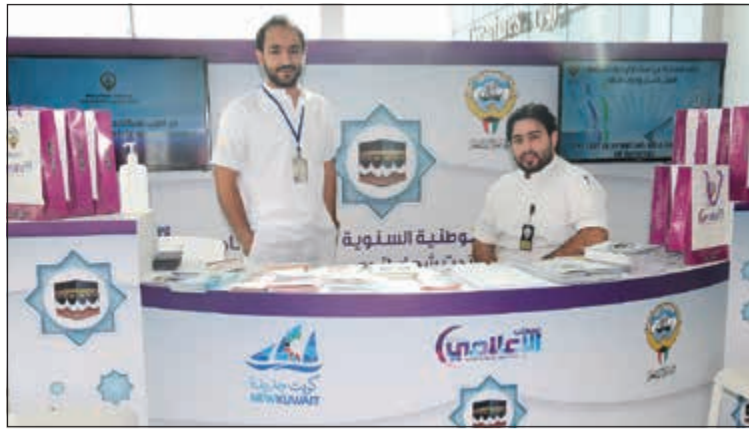
وزارة الصحة.. وجهود مشهودة في تقديم النصائح للحجاج