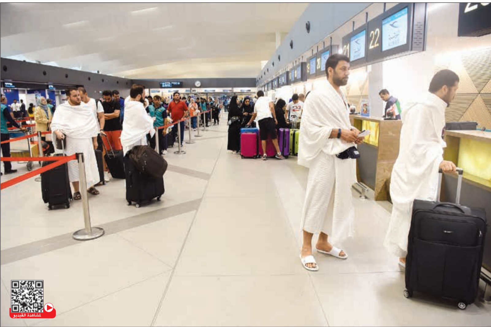
أوائل الحجاء المغادرين ل أداء فريضة الحج أمس (أحمد علي)

«الأنباء» تابعت مغادرة أولى طلائع حجاج بيت الله الحرام في مطار الكويت الدولي 03