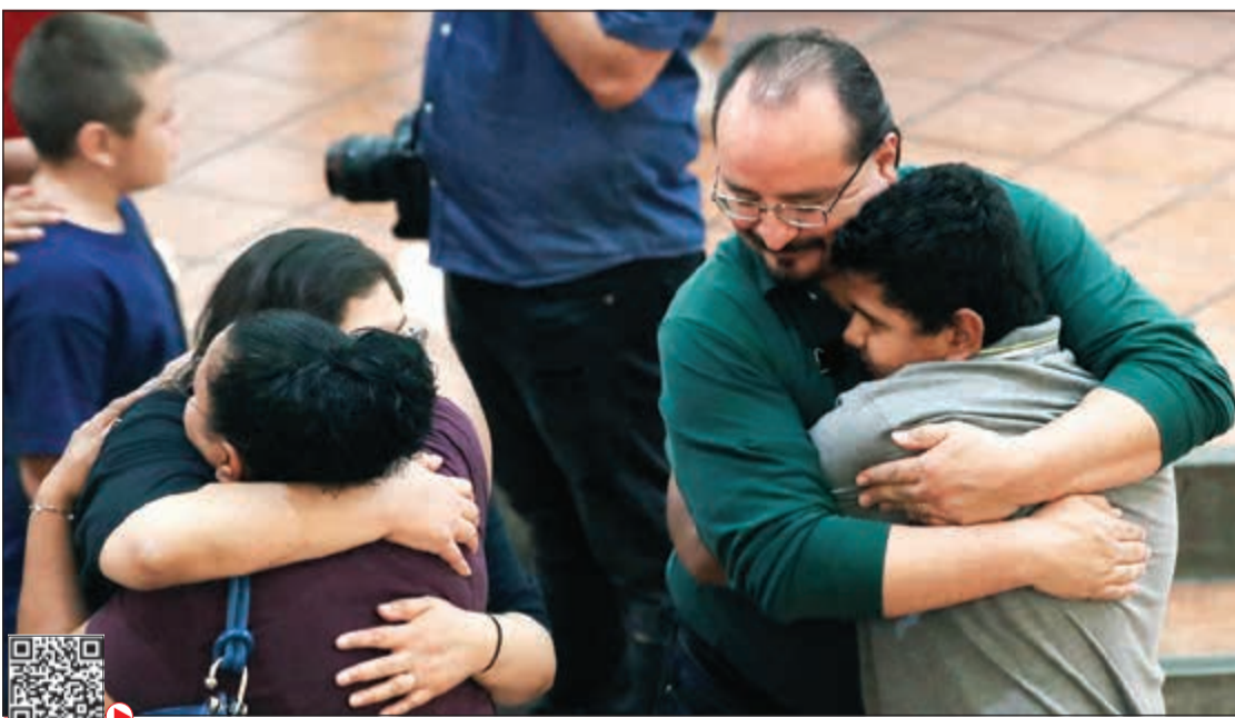
أميركيون يواسون بعضهم حزناً على ضحايا المنحة في مدينة «إل باسو» بولاية تكساس الأمريكية (أ.ف.ب)

سفاح إل باسو الأميركي معجب بـ «جزر المسجدين» النيوزيلندي