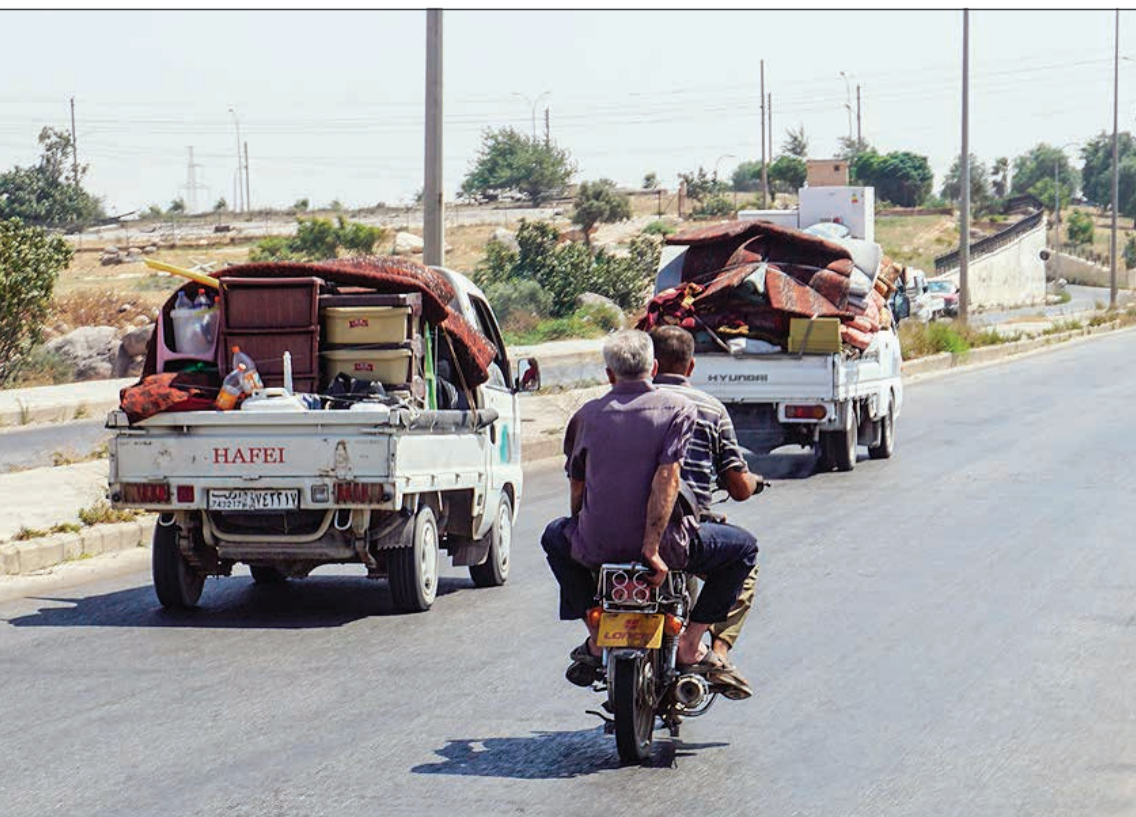
سوريون يعودون إلى منازلهم بعد سريان وقف إطلاق النار في ادلب ومحيطها

المدنيين لنقاط الرباط والأماكن المحاذية لخطوط التماس». وجاء ذلك بعدما توجه مئات النازحين إلى مناطق ريف ادلب لتفقد منازلهم ومزارعهم في اليوم الثاني من اتفاق وقف النار، الذي أعلن عنه تزامنا مع اجتماعات الجولة 13 من اتفاق استانا التي انتهت أمس الأول في العاصمة الكازاخية نورسلطان. وقال قيادي في الدفاع المدني التابع للمعارضة السورية، رفض ذكر اسمه لـ (د.ب.أ.): «عاد المئات من الأشخاص من مخيمات ريف ادلب إلى مناطق ريف حماة الشمالي وادلب الجنوبي لتفقد منازلهم ومزارعهم تمهيدا لجلب عائلاتهم إلى تلك المنطقة». وأضاف المصدر أن «إشكالات حصلت مع بعض حواجز فاصلت المعارضة الذين منعوا الأهالي من تفقد ممتلكاتهم، وتعمل مجالس ريف حماة وادلب المدنية للتوصل إلى تفاهم مع قيادات فصائل المعارضة لتأمين عودة المدنيين الذين يمكنهم العودة إلى مناطقهم».