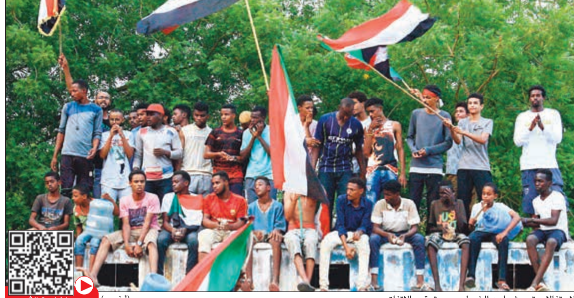
الاحتفالات تعم شوارع الخرطوم بعد توقيع الاتفاق مشاهدة الفيديو