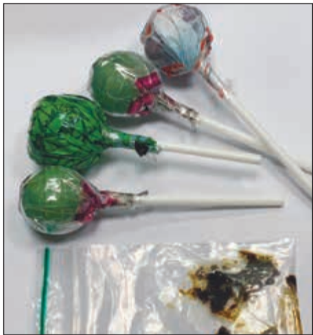
المواطنة أخفت الحشيش في مصاصات

المدير العام لشؤون المنافذ الشيخ فيصل العبد الله وجه بإحالتهم إلى الإدارة المختصة في وزارة الداخلية لاستكمال إجراءات الملاحقة القضائية، وتأتي الضبطيات الأخيرة بعد أيام من ضبطيات مماثلة في الجمرك الجوي. وحول الضبطيات، ذكر عضو بلجنة الإعلام الجمركي أن أحد المفتشين في الـ T4 اشتبه بسيدة وصلت الكويت أمس من دولة مجاورة، ولدى تفتيش أمتعتها عثر على نحو 1480 حبة يشتبه أنها مخدرة. وأضاف: اشتبه مفتش في