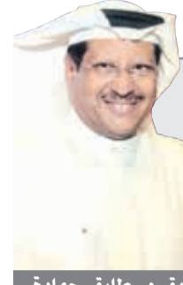
الفريق م. طارق حمادة

أحبال رجال الجمرك إلى الإدارة العامة لمكافحة المخدرات خلال الـ 48 ساعة الماضية مواطننا وامراتين محاولة تهريب حشيش وحبوب مخدرة وماريفوانا، وبحسب مصدر في المكافحة فإن المهربين الـ 3 وصلوا إلى الكويت من الدول التالية: أمستردام وأميركا وإيران، وقال المصدر لـ «الأنباء» إن الحبوب المهربة قدمت بها مواطنة من إيران، فيما الحشيش قدمت به مواطنة أخرى من أمستردام أما الماريغوانا فضبطت