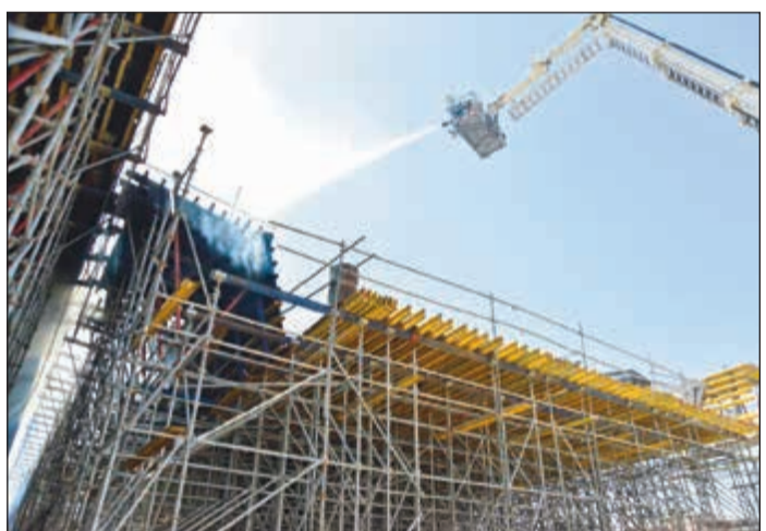
رجال الإطفاء استخدموا السلالم للسيطرة على ألسنة اللهب