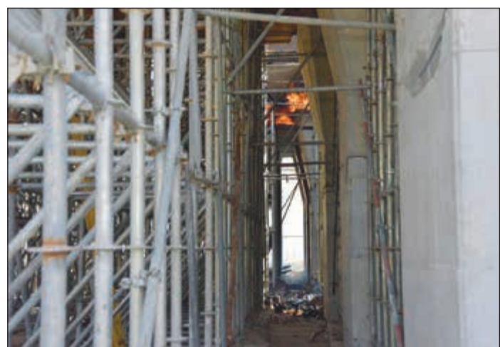
النيران تبدو أسفل الجسر قبل السيطرة عليها

وكان بلاغ قد ورد إلى عمليات الإطفاء ظهر الجمعة عن حريق في جسر قيد الإنشاء بين منطقتي الفردوس والأندلس، حيث سارع رجال إطفاء الصليبخات والعراضية والإسناد ومشرف