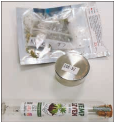
الماريفوانا التي جلبها المواطن من أميركا