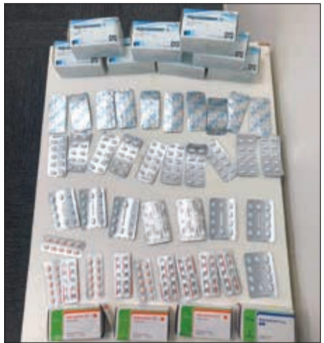
الحبوب التي أتت بها المواطنة من إيران