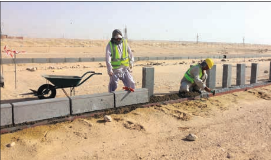
أعمال صب الحواجز الإسمنتية