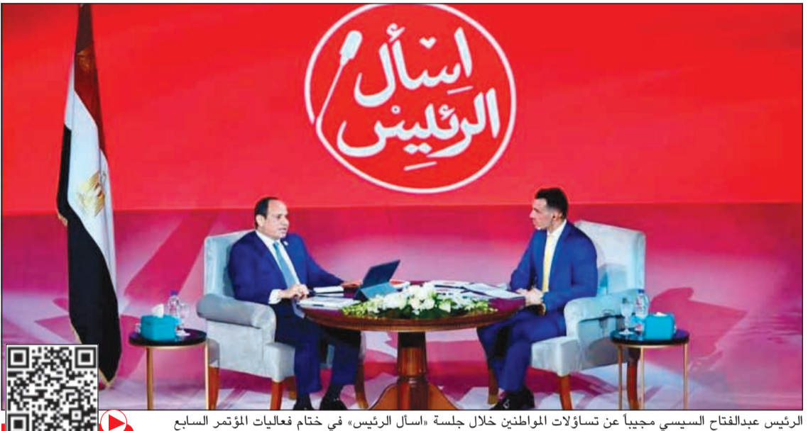
الرئيس عبدالفتاح السيسي يجيباً عن تساؤلات المواطنين خلال جلسة «أسأل الرئيس» في ختام فعاليات المؤتمر السابع للشباب مساء أمس الأول

وأوضح البيان بحسب الصفحة الرسمية للوزارة، ان قرار الزيادة هذا جرى الإعلان عنه مسبقاً منذ عدة أشهر، وهو يخص المطارات الداخلية فقط، ولا يطبق على مطار القاهرة، حيث إنه مطبق بالفعل بالمطار منذ عام 2014، لافتاً إلى أن الزيادة تم إقرارها من خلال اللجنة العليا للتسعير والتنسيق مع وزارة السياحة، كما تم عقد اجتماع مع شركات الطيران في منتصف شهر يوليو الماضي وتم الاتفاق معها على