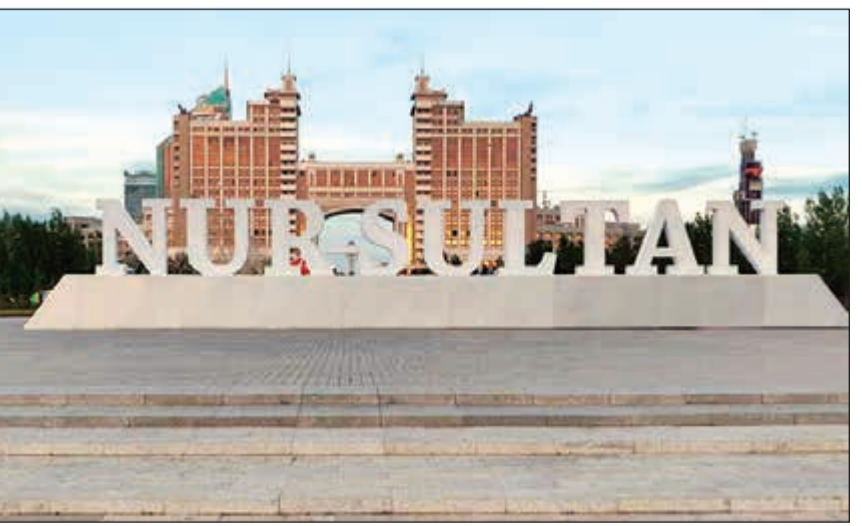
العاصمة الكازاخية نورسلطان (أرشيف)

اتخاذ القرارات في اللجنة الدستورية. وقال المصدر: «إذا لم يكن هناك إجماع، فينبغي أن يكون 70٪ على الأقل من الأصوات. لا أحد لديه مثل هذه الحصة، نحن بحاجة إلى إيجاد حلول والعمل».