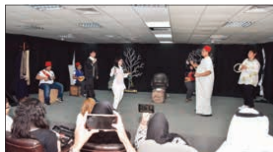
مشهد من مسرحية «الحلم»

انساني تريد من ورائه اخراج طاقات ذوي الهمم المدفونة حتى يشاركوا اصدياقهم الاصحاء في تنمية مواهبهم وحتى لا تكون الإعاقة سببا في عدم تحقيق احلامهم في الحياة.