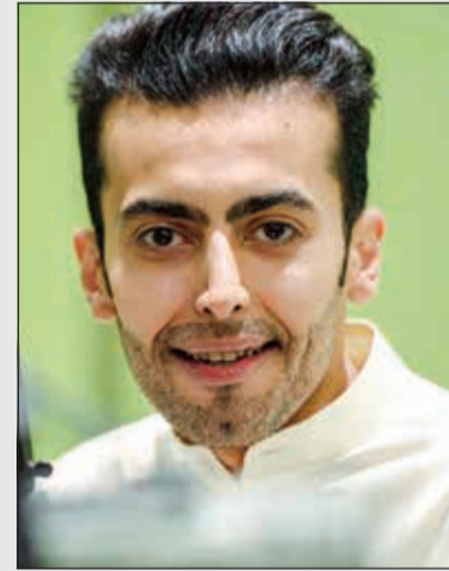
المذيع محمد خليفة