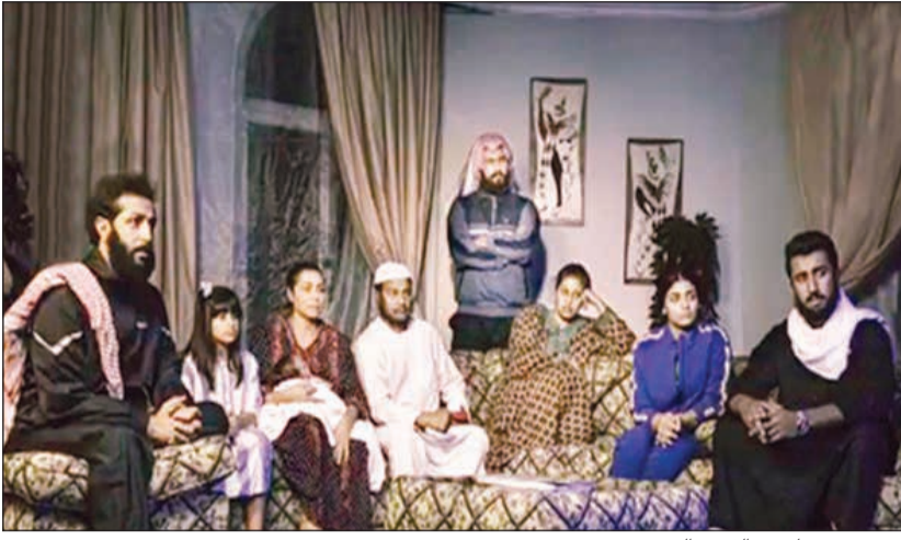
مشهد من فيلم «سالفتي بالغزو»

في الذكرى الـ 29 للاحتلال العراقي الغاشم