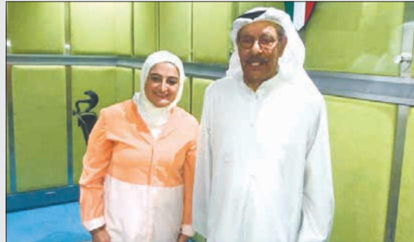
الشاعر الكبير بدر بورسلي والمعدة الزميله الاء الوزان في استديو البرنامج

حين قرر السفر إلى الولايات المتحدة الأمريكية عام 1965 لاستكمال دراسته في الهندسة، إلا أنه قرر تغيير اتجاهه في دراسة الإعلام فعاد إلى وطنه حاملا شهادة اجازة في الاخراج من لوس انجليس. وبدر بورسلي من نوع السهل الممتنع، شعره يتغلغل بوجداننا بمفرداته الكويتية «العتيبة»، التي تلامس قلوبنا وتميزه بالمنطوق الكويتي الاصيل، وتالق في شموليته ومعاصرته لأكثر من جيل، هو شاعر «وطن النهار» وكل كلمة تغنت بحب الكويت، ولي طرى علينا نضف ونقول «مرني مرني اذا الوقت يسمحك وتقدر وعسى وقتك يوافق يا عم بوناصر»، و«الحمد لله الوقت سمح وسير علينا اليوم ونور قلوبنا وكحلت عيوننا بشوقه»، بتلك الكلمات المعبرة والتابعة من القلب عبرت أسرة برنامج «منشن» عن سعادتهم باستضافة بورسلي، ورغم ان وقت البرنامج الأساسي يفترض انه «من الثمان لي