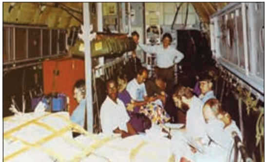
مجموعة الصباح في طريق عودتها إلى الكويت أكتوبر 1991

عنصرنا يمكن إدراكه عقلياً، وهو أن العراقيين نعموا في الكويت بنيتها التحتية الثرية والحديثة، فكان التدمير الجنوني للبنية التحتية مثل المباني العامة والمحطات الكهربائية والمياه والمتاحف والمكتبات، فعلى سبيل المثال: استخدمت أسلحة مضادة للدبابات لنسف برج الساعة في قصر السيف، ثم أضرمت النيران في المكتبة المغطاة بالواح خشبية والمباني الأنيقة ذات الطابع المغربي الأندلسي. كما أن التدمير الذي أحدثه حشد النظام العراقي ورجبته في الهيمية يستدعي إلى الذاكرة وسائل شن الحرب التوسعية المماثلة لجرائم النازيين والصرب والمأويين