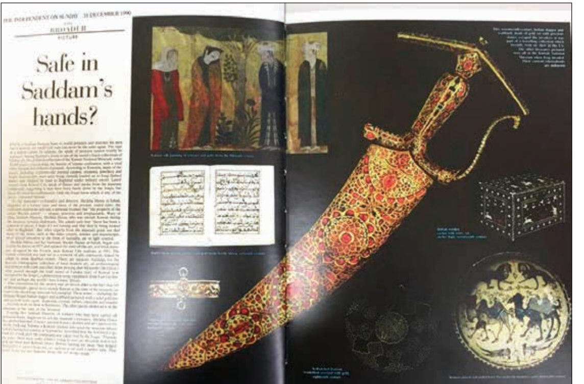
مقال «اليمان هي بين يدي صدام»، في صحيفة ذا إنديبندنت أون صندي، بتاريخ 16 ديسمبر 1990

أشارت الدراسة إلى اهتمام المنظمات الدولية (هيئة الأمم المتحدة، اليونسكو، المنظمات العربية والإسلامية) برصد آثار العدوان العراقي على الكويت، وحصر الأضرار التي لحقت بالبنية الحضارية والمؤسسات العلمية والثقافية، وفيما يلي مقتطفات من هذه التقارير التي أعدتها البعثات التي أوفدها بعض هذه المنظمات