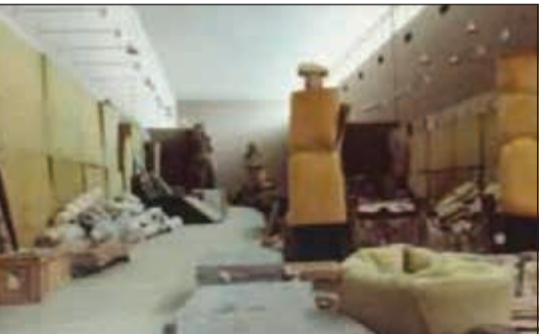
مجموعة الصباح تمت معاينة كل قطعة فيها معاينة شاملة قبل إعادتها

إبادة الكتب والمحو وسرابة الأصل ولغقت الدراسة إلى انه في أثناء عهد الإرهاب الذي امتد لـ 6 أشهر تحت هيمنة 100 ألف جندي عراقي دُمرت البنية التحتية الاقتصادية والثقافية للكويت، ما ترك البلاد مجرد هيكل متداع، وقد استهدف الاحتلال الكويتيين أفراداً وجماعات، حيث دُمرت ممتلكاتهم الشخصية، وآثارهم الثقافية ومؤسساتهم، ولم يكن في الحياة الكويتية أي ملمح صغير أو كبير إلا طالته يد الحملة العراقية، وكانت المؤسسات الثقافية والتعليمية - بما فيها المكتبات ومراكز المعلومات - الأكثر تضرراً جراء الاحتلال. واستخدمت المدارس مراكز قيادة ومستودعات ذخيرة، ودمر نحو 43٪ من مخزون الكتب في المكتبات المدرسية.