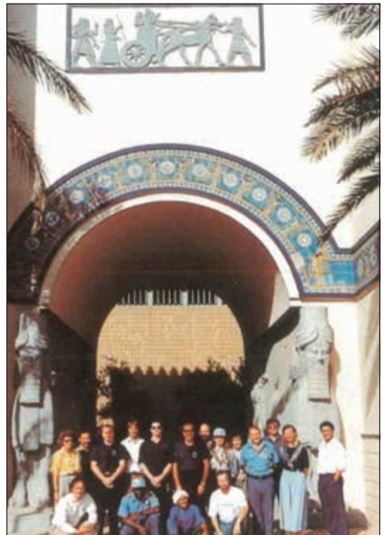
فريق إعادة مجموعة الصباح من العراق

النظام هجماتها ضد الاقتصاد بإضرار النيران في حقول البترول، وضرب قواعدها الثقافية والفكرية، فعندما وصل مدير المتاحف ببغداد إلى الكويت، أجرى مسحاً لجموعة محتويات (متحف الكويت الوطني)، وشحن الآثار التي تثير اهتماماً خاصاً إلى العراق، ثم أحرق مجمع المتحف بكامله، وشملت الخسائر كتباً في الفن، ومخطوطات في مكتبة كانت موضع تقدير بالغ من الباحثين (مركز المخطوطات والتراث والوثائق نموذجاً)، وأحرقت القوات النظامية القبة السماوية والمعالم الجاورة، ودمرت آثاراً عديدة من الثقافة العربية القديمة في هذا العدوان.