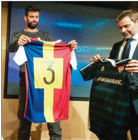
جيرار بيكيه يرفع قميص اف سي اندورا في مناسبة سابقة