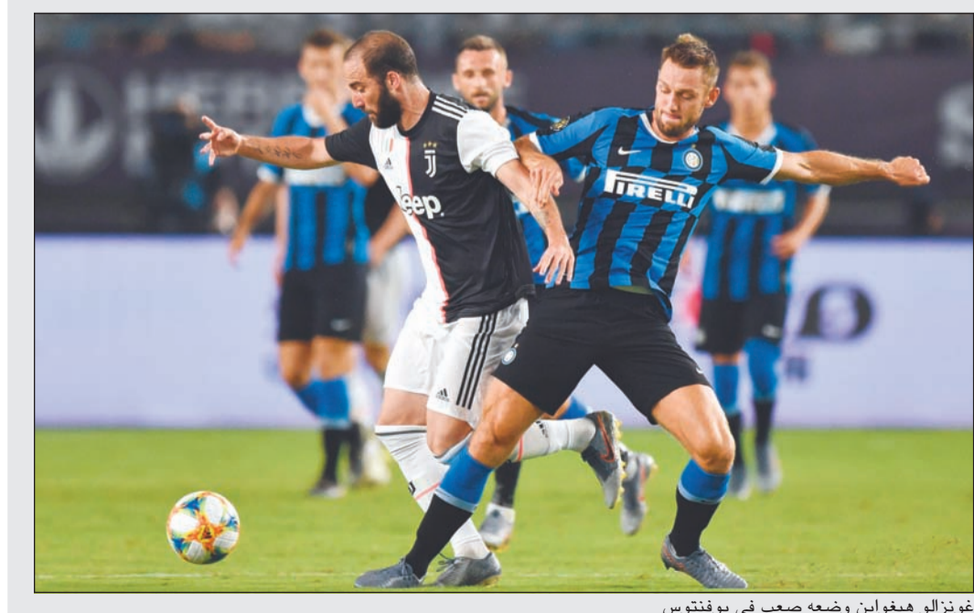
غونزالو هيفواين وضعه صعب في يوفنتوس

يتمسك روما الإيطالي بالتعاقد مع مهاجم يوفنتوس غونزالو هيفواين لتدعيم صفوف الفريق خلال فترة الانتقالات الصيفية الحالية.