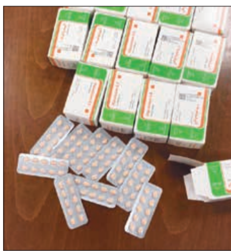
الحبوب المضبوطة مع المواطن احيات للاختصاص

من انتشاره إلى الأدوار الأخرى أو الأماكن المجاورة. ولم ينتج الحادث عن أي إصابات بشرية واقتصرت على الأضرار المادية، هذا وقد