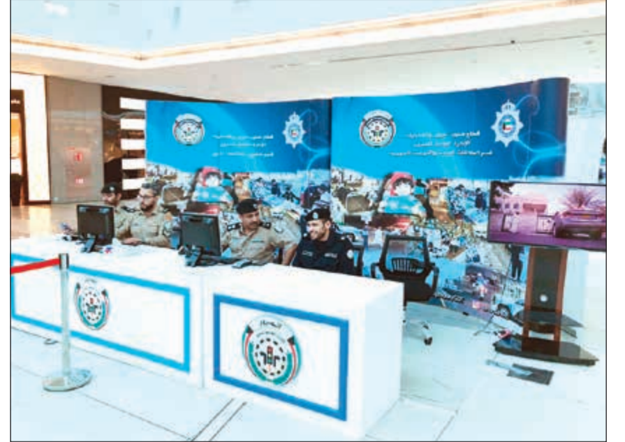
ضباط وضباط صف من الإدارة العامة للمرور جاهزون لاستقبال المخالفين في الأفتنيوز

المزودة بكاميرا مخصصة لتصوير وتوثيق المخالفات المرورية الخاصة بالوقوف بالمنوع وصف ثانية، على ان تبدأ السيارة بمباشرة عملها عقب حملة توعوية لهذا الغرض.