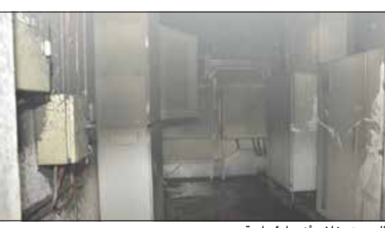
الحريق خلف أضراماً مادية

باشرت مراقبة التحقيق في حوادث الحريق عملها لمعرفة أسباب الحريق. وتواجد في الموقع رجال الأمن ورجال الطوارئ الطبية.