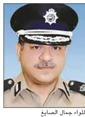
اللواء جمال الصايغ

وغيرها، وكذلك مخولون بالإفراج عن السيارات المحجوزة والاستعلام عن سداد المخالفات، مؤكداً ان الفرصة متاحة لجميع الأشخاص المخالفين لتسديد مخالفاتهم المرورية والإفراج الفوري عن السيارات المحجوزة، لافتاً الى ان عدم التردد على المعرض بالنسبة لمرتكبي المخالفات الجسيمة قد يعرض مركبتهم للحجز