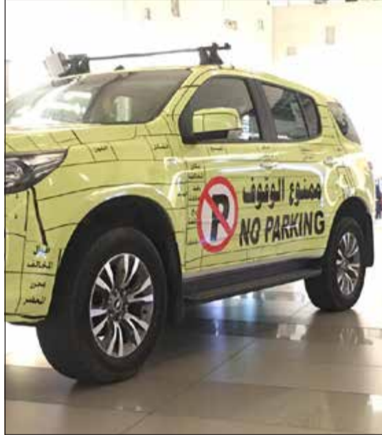
السيارة المزودة بكاميرا خلال عرضها داخل الأفتنيوز