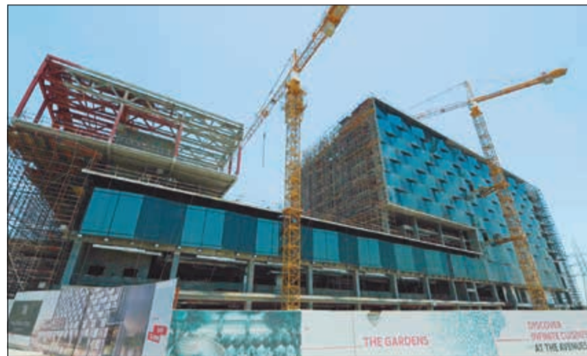
فندق والدورف أستوريا بالأفنيوز