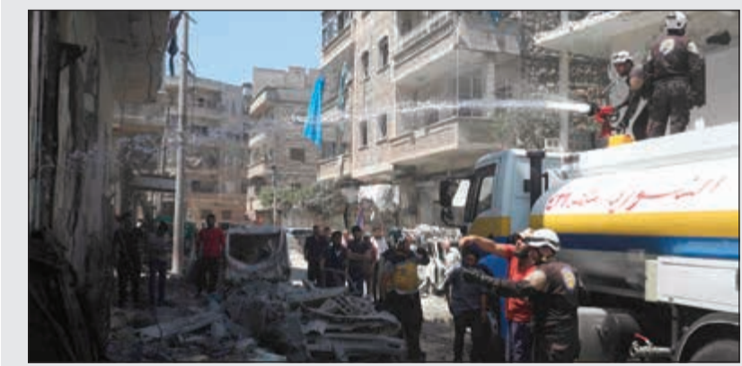
عناصر من الدفاع المدني «الخوذ البيضاء» يخمدون النيران التي سببتها غارة على أريحا (أ.ف.ب)

على حي الحمداية بالقسم الغربي من مدينة حلب الخاضعة لسيطرة قوات النظام منذ أيام. وأضاف المرصد أن الطائرات الحربية السورية نفذت 50 غارة أمس مستهدفة أماكن في محور كباتة في جبل الأكراد، إلى جانب 34 غارة نفذتها الطائرات الروسية على كل من كفرزيتا وللطامنة ومورك وحصرايا ولطمين والصيد والأربعين بريف حماة الشمالي. وقال المرصد بحسب بيان على صفحته على فيسبوك إن 26 بريلاً متفجراً التي ألقاها الطيران المروحي على محور كباتة بجبل الأكراد وبلدة مورك وقرية حصرايا شمال حماة.