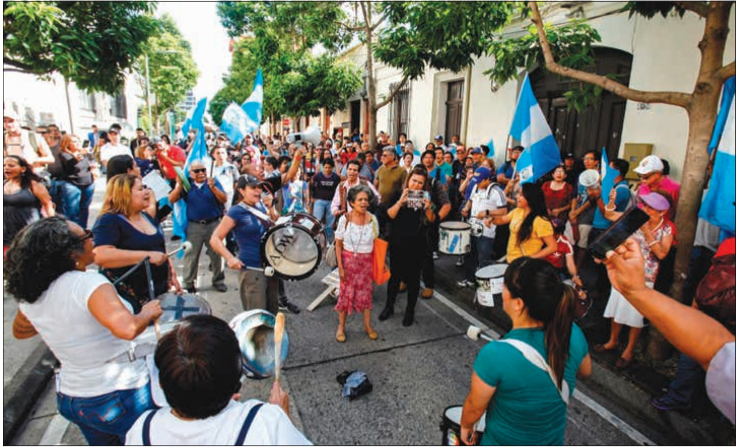
محتجون يتظاهرون في جواتيمالا ضد سياسات ترامب العنصرية للمهاجرين امس

مع جيراني. من واجباتي الدستورية أن أشرف على السلطة التنفيذية. لكنه من واجبي المعنوي أن أخوض معارك من أجل ناخبي».