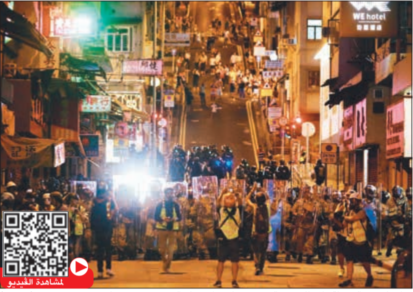
مواجهات بين الشرطة والمظاهرين بالقرب من مكتب الاتصال الصيني في هونغ كونغ

وقالت السلطات إنها ألقت القبض على 11 شخصا أمس الأول، بينهم مختلفة من بينها الاعتداء وحبساً أسلحة هجومية والتجمع غير القانوني في منطقة لوونغ الشمالية القريبة من الحدود مع الصين. كما تجمع آلاف المحتجين في متنزه بوسط المدينة قبل انطلاق مسيرة في تحد للقيود التي تفرضها الشرطة وهم يرددون شعارات «الشرطة السوداء» عار عليكم». ورفع البعض لافتات تقول «تقف معا وتقاتل معا» و«أوقفوا العنف». وفي مكان آخر بالمدينة، جمع آلاف المظاهرين الحواجز لإغلاق الشوارع في منطقة تسوق تحظى بشعبية، بينما احتل آلاف آخرون حديقة بالمنطقة التجارية الرئيسية.