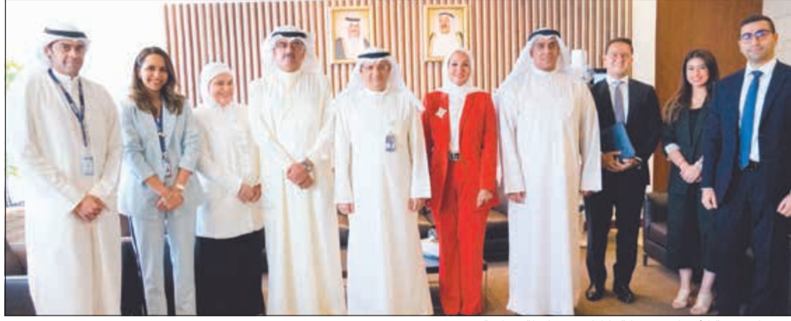
مسؤولو «هيئة الأسواق» وشركة «كامكو» في لقطة جماعية

تنفيذاً لقرار مجلس مفوضي هيئة أسواق المال بترسية المناقصة رقم 2019/02/CMA/PROC على شركة كامكو للاستثمار، قامت الهيئة وشركة كامكو بالتوقيع على عقد إدارة طرح أسهم شركة بورصة الكويت للأوراق المالية للاكتتاب العام للمواطنين بنسبة 50% من رأسمال الشركة. ويشمل عقد الخدمات المقدمة من قبل شركة كامكو للاستثمار إعداد نشرة الاكتتاب ودعوة جميع المواطنين الكويتيين المسجلة أسماؤهم في الهيئة العامة للمعلومات المدنية في يوم الاكتتاب، فضلاً عن الإشراف على عملية تخصيص الأسهم التي لم يتم سداد قيمتها للهيئة بما يضمن تغطية نسبة 50% المخصصة للمواطنين بالكامل للاستثمار ومجموعة أرزاق المالية للمؤسسة العامة كما قامت المؤسسة العامة للتأمينات الاجتماعية بتاريخ 2019/02/18 بالاكتمال في الحصة البالغة 6% من رأس مال شركة البورصة، المخصصة للجهات العامة،