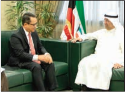
.. وخلال استقبال سفير جمهورية إندونيسيا تري تاريت

استقبل وزير المالية د. نايف الحجرف أمس سفير كوريا الجنوبية لدى الكويت هونغ يونغ كي، وتم خلال اللقاء متابعة نتائج زيارة رئيس الوزراء الكوري للكويت، كما تمت مناقشة عدد من المواضيع ذات الاهتمام المشترك في المجالات المالية والضريبية والتنمية، واستعداد الجانبين لعقد اللجنة الفنية للتحضير لاجتماعات اللجنة الوزارية الكويتية - الكورية المشتركة والتي يترأسها وزير المالية من الجانب الكويتي ومن الجانب الكوري وزير المالية والاقتصاد في موعد يتم تحديده لاحقاً. في سياق متصل، استقبل وزير المالية د. نايف الحجرف سفير جمهورية الصين الشعبية لدى الكويت لي مينغ قانغ، حيث تم خلال اللقاء بحث استعداد الجانبين لعقد الدورة السادسة للجنة الكويتية - الصينية المشتركة برئاسة وكيل وزارة المالية