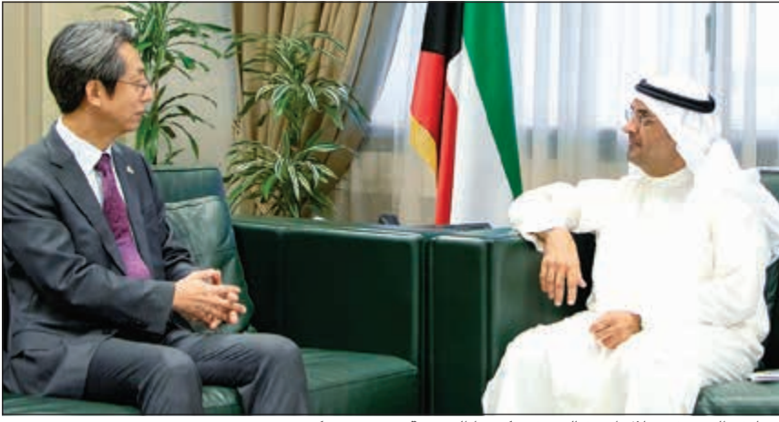
د. نايف الحجرف خلال استقباله سفير كوريا الجنوبية هونغ يونغ كي

عن الجانب الكويتي ونائب وزير التجارة والصناعة عن الجانب الصيني خلال الفترة من 13 إلى 14 نوفمبر 2019، وذلك في الكويت. تجدر الإشارة إلى العلاقات التاريخية والشراكة المتميزة التي تجمع البلدين الصديقين في ظل ما تشهده العلاقات الاقتصادية والاستثمارية الكويتية - الصينية من نمو على جميع المستويات خصوصاً بعد الزيارات الرسمية رفيعة المستوى والمسؤولين في كلا البلدين. كما استقبل الحجرف سفير جمهورية إندونيسيا لدى الكويت تري تاريت وذلك بمناسبة تعيينه سفيراً جديداً لإندونيسيا في الكويت، وتم خلال اللقاء مناقشة عدد من المواضيع المالية والاستثمارية وذلك في إطار تعزيز العلاقات الاقتصادية الثنائية بين الكويت وجمهورية إندونيسيا.