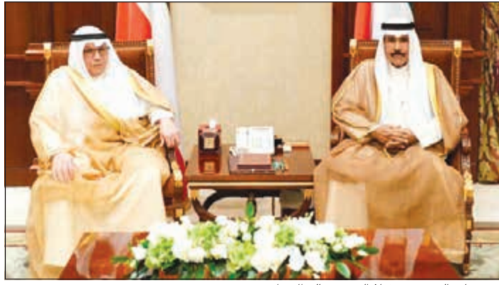
سمو ولي العهد مستقبلاً الشيخ خالد الجراح