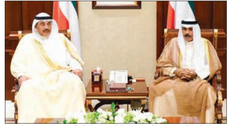
سمو ولي العهد الشيخ نواف الأحمد مستقبلاً الشيخ صباح الخالد

أمس نائب رئيس مجلس الوزراء ووزير الخارجية الشيخ صباح الخالد، واستقبل سموه بقصر بيان أمس نائب رئيس مجلس الوزراء ووزير الداخلية الشيخ خالد الجراح.