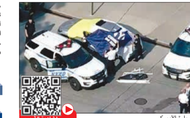
رجال الشرطة حول سيارة الأميركي

نقلت صحيفة ديلي نيوز عن السلطات أن طفلين صغيرين توفيا الجمعة داخل سيارة سائنة في أجواء شديدة الحرارة بحي بروكس بعد أن نسيهما والدتهما في المقعد الخلفي وتوجه إلى العمل. وقالت ديلي نيوز نقلاً عن الشرطة إن التوأمين وهما أخ واخت بقيا من الساعة الثامنة صباحاً حتى الرابعة عصراً مقيدتين في مقاعد السيارة وهي من طراز هوندا. وأوردت الصحيفة أنه عندما غادر الأب البالغ من العمر 37 عاماً عمله في المركز الطبي لإدارة المحاربين القدامى في كينجزبريدج، قطع مسافة قصيرة ثم أدرك ما فعله.