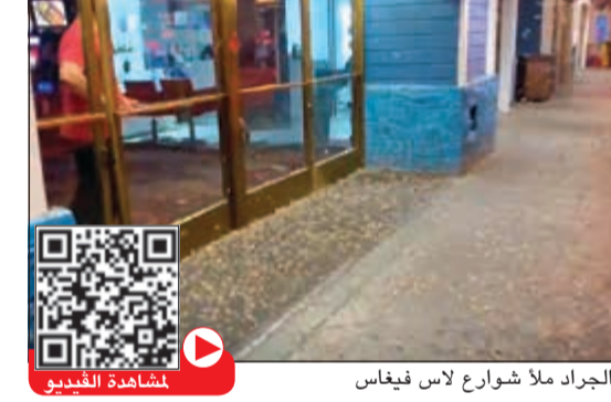
الجراد ملأ شوارع لاس فيغاس

أ.ف.ب: اجتاحت جحافل من الجراد جادة ستريب في لاس فيغاس في الأسبوع الحالي خلال هجرتها إلى المناطق الشمالية مثيرة ذهول السياح والمقيمين، وأظهرت مقاطع مصورة بثت عبر وسائل التواصل الاجتماعي أسراباً من هذه الحشرات، تتكفل على أضواء اللوحات الإعلانية البراقة في هذه الجادة الشهيرة أو تغطي أرفصه الشوارع. وقالت دائرة الزراعة في ولاية نيفادا إن الإحتياج النادر الحصول مرتبط بالشتاء والربيع الماطرين بشكل استثنائي. وقال جيف نايت عالم الحشرات في وزارة الزراعة الأميركية إن الحشرات قد تثير الخوف في نفوس كثيرين، إلا أنها غير مؤذية ولا تشكل «مؤشراً إلى نهاية العالم». وقال إن هذه الجراد البالغ طولها 3,8 سنتيمترات تقريبا ستغادر لاس فيغاس في غضون أسبوعين كحد أقصى. وأشار إلى أنها «تأتي وتستقر وفي الليل تنطلق وتغامر»، واعتبر أن الطريقة الفضلى لتجنب جذب هذه الحشرات التي تستهويها الأشعة فوق البنفسجية، هي استخدام أنوار صفراء أو كهربائية اللون.