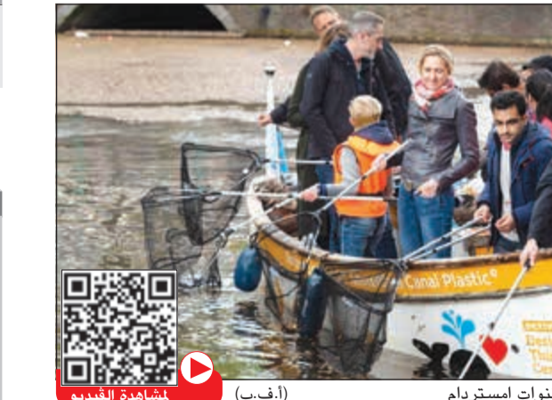
متطوعون «بصطادون» البلاستيك في قنوات أمستردام

أ.ف.ب: ينشغل أفراد مجموعة صغيرة على أحد المراكب الكثيرة التي تجوب قنوات أمستردام الشهيرة مسلحين بشباك صيد وقفازات سميكة محاولين جمع أكبر كمية ممكنة من النفايات البلاستيكية. ويقوم هؤلاء الركاب بـ «صيد البلاستيك» خلال جولة بالمركب تستمر ساعتين في قنوات المدينة التي تعتبر من نقاط الجذب السياحي الرئيسية في المدينة وجزء منها مدرج على قائمة التراث العالمي لليونسكو التي تعدها اليونسكو. وفي خضم فورة السياحة المرعبة للمدينة، تسجل هذه الرحلات التي تنظمها شركة «بلاستيك وايل» الهولندية نجاحاً متنامياً. في العام 2018، شارك فيها نحو 12 ألف شخص، وسيزيد العدد هذه السنة، على ما يؤكد ماريوس سميت مؤسس «بلاستيك وايل»، وكان