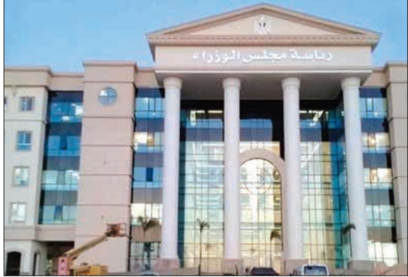
المبنى الجديد لرئاسة مجلس الوزراء في مدينة العلمين الجديدة