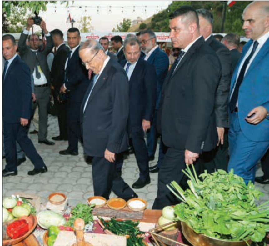
الرئيس ميشال عون متفتحا «اليوم العالمي للتدوق» بحضور وزير الخارجية جبران باسيل في زحلة

أما باقي الفئات الأدنى، فتقرها امتحانات مجلس الخدمة المدنية. واستناداً إلى ذلك، وقع رئيس الحكومة سعد الحريري قانون الموازنة، ومثله رئيس مجلس النواب نبيه بري، مما أربك موقف من تشوا على الرئيس ميشال رداً إلى مجلس النواب من دون توقيع، كما فعل بالنسبة لقانوني: مكافحة الفساد، وإعطاء أولاد المرأة اللبنانية المتزوجة من غير لبناني، إجازة عمل، بعدما تبين أن هناك 900 ألف مولود منذ 1954 تنطبق عليهم هذه الحالة، بينهم 40 ألف مسيحي فقط. الوزير جبران باسيل حدد عن رئيس الجمهورية مال