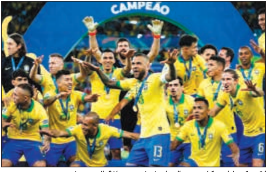
لقب كوبا أميركا يضع البرازيل في وصافة التصنيف

تراجعت فرنسا بطلتة العالم الى المركز الثالث في التصنيف الشهري الصادر عن الاتحاد الدولي لكرة القدم أمس وخسرت مركزها للبرازيل المتوجة بلقب «كوبا أميركا». واحتفظت بلجيكا بالصدارة مع 1746 نقطة بفارق 20 نقطة فقط عن البرازيل (1726)، فيما تجردت فرنسا عند 1718 نقطة. وضمن العشرة الأوائل، ارتقت الأوروغواي 3 مراكز وأصبحت خامسة، وكولومبيا 5 وأصبحت ثامنة. وحقت الجزائر المتوجة بلقب كأس أمم أفريقيا للمرة الثانية في تاريخها قفزة كبيرة بلغت 28 مركزاً لتصبح في المركز الـ 40 والرابع أفريقياً، خلف وصيفتها السنغال (20) وتونس (29) ونيجيريا (33)، كما تقدم المغرب (41) ومصر (49).