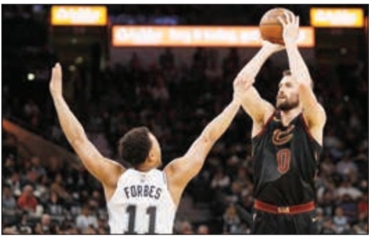
كيفن لوف يفضل التركيز على استعدادات فريقه كليفلاند كافالييرز

بات نجم كليفلاند كافالييرز كيفن لوف تاسع لاعب يعلن غيابه عن تشكيلة المنتخب الأميركي الذي سيدافع عن لقبه في مونديال السلة هذا الصيف في الصين، بحسب ما أفادت وسائل إعلام أميركية. وأعلن موقع «اتلتيك» الرياضي أن لوف المتوج بلقب الدوري مع كليفلاند عام 2016 والفائز بالمدالية الذهبية مع المنتخب الأميركي في أولمبياد لندن 2012 وبذهبية بطولة العالم في تركيا 2010، أعلم مدرب المنتخب غريغ بوبوفيتش قراره بعدم الالتحاق بصقوف الفريق. وانضم ابن الـ 30 عاماً إلى قائمة كبيرة من لاعبي الدوري الأميركي للمحترفين رفضوا اللعب للمنتخب على غرار كل من الهداف وأفضل لاعب في الدوري عام 2018 جيمس هاردن، أنطوني ديفيس المنتقل حديثاً إلى لوس أنجيليس ليكرز.