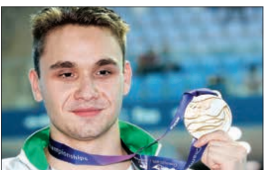
كريستوف ميلاك يرفع الميدالية الذهبية

حبا السباح الأسطورة الأميركي مايكل فيلبس انجاز الشاب المجري كريستوف ميلاك، مفضلاً على «تقنيته الجميلة» بعدما حطم رقمه القياسي في سباق 200م فرأشه في بطولة العالم للسباحة المقامة في غوانغجو بكوريا الجنوبية. ووصف فيلبس التوقيت القياسي الذي حققه ميلاك وقدره 1:50.73 دقيقة بـ «المذهل»، على الرغم من إقراره بأنه شعر بالحزن لفقدانه رقمه القياسي السابق الذي حققه عام 2009. إلى ذلك، حطم المنتخب الأسترالي للسيدات الرقم القياسي العالمي لسباق التتابع أربع مرات 200م حرة بتسجيله 7:41.50 دقائق أمس. وكان الرقم السابق وهو 7:42.08 بحوزة سيدات الصين وسجلته في 30 يوليو 2009 في بطولة العالم في روما.