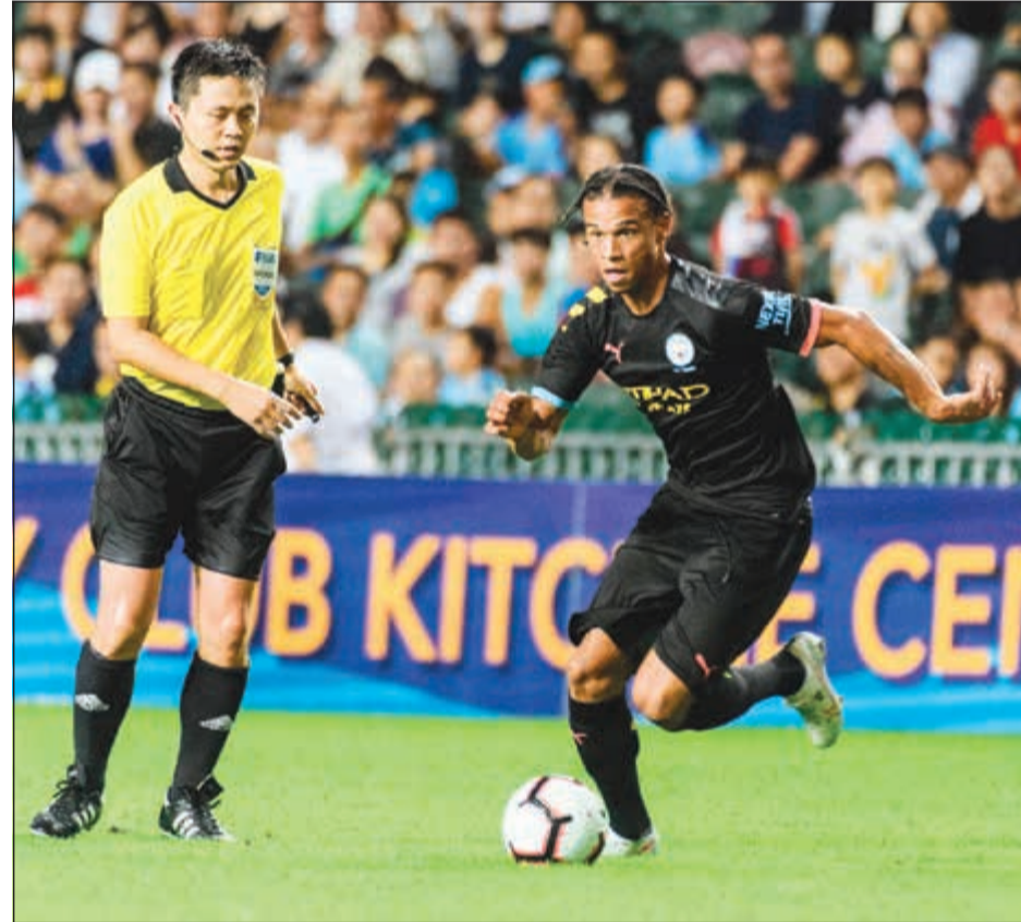
ليروي ساني يحتاج تحديد مصيره بأقرب وقت

أفادت تقارير صحافية ألمانية بأن مطاردة بايرن ميونيخ، بطل «البوندسليغا»، لنجاح مان سيتي الإنجليزي والمنتخب الألماني ليروي ساني لم تحقق أي تقدم، وحالياً لا يوجد تواصل بين ساني والعملاق البافاري، وفقاً لمجلة «كيكر» في الوقت الذي يتدفق فيه الوقت لإبرام الانتقال المحتمل.