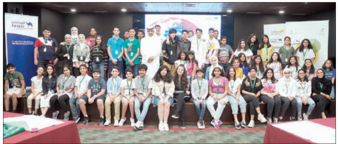
لقطة تذكارية مع المشاركين في برنامج «كن» التدريبي

■ قياديون من بنك الكويت الوطني قدموا خبراتهم ومشورتهم للطلبة وللمشاريع المتنافسة