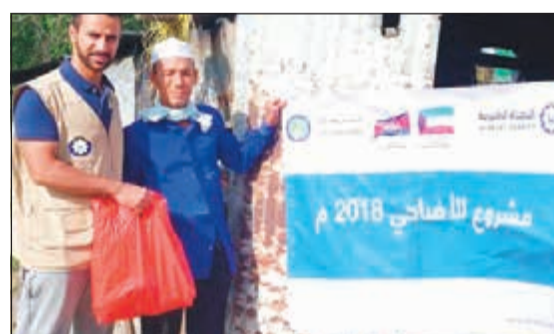
إشراف مباشر على إيصال الأضاحي