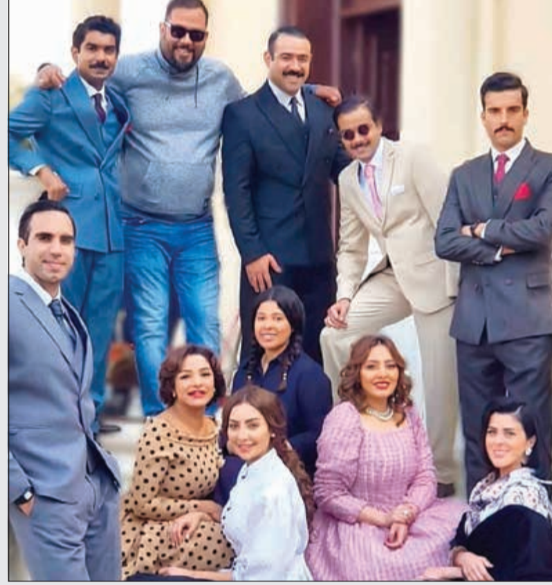
نجوم «دفعة القاهرة» يتوسطهم المخرج علي العلي

بعد النجاح الكبير الذي حققه «دفعة القاهرة»