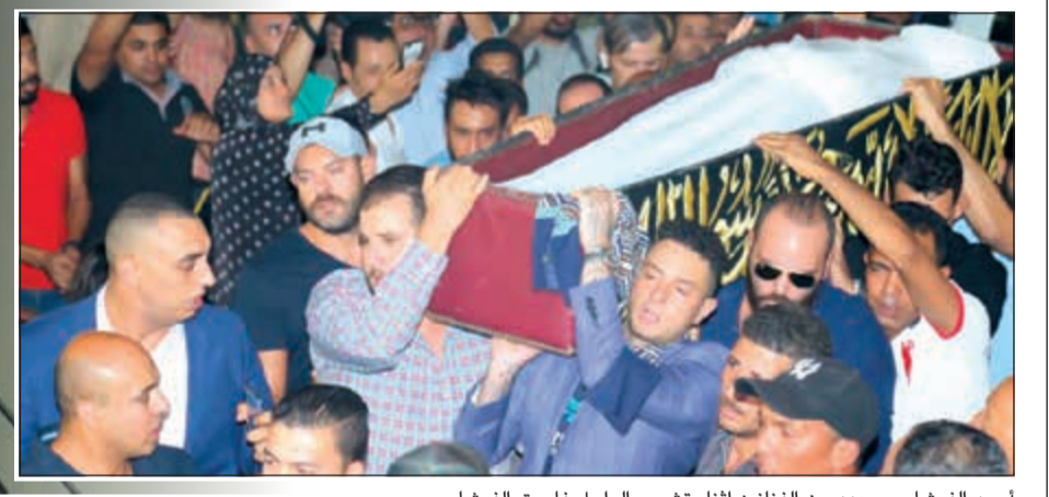
أحمد الفيشاوي وعدد من الفنانين أثناء تشييع الراحل فاروق الفيشاوي