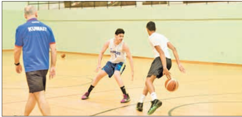
منتخب السلة يواصل استعداداته المحلية قبل البطولة القاهري (ريليش كومار)