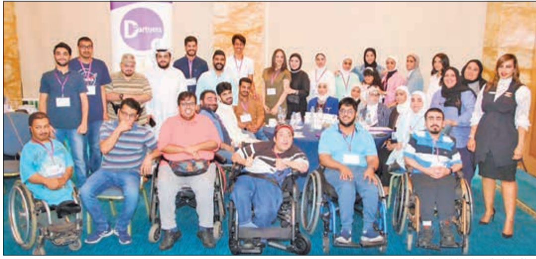
لقطة تذكارية مع المشاركين بالبرنامج

أعلن بنك برقان، أحد أبرز المساهمين في مشاريع التنمية الاجتماعية، عن رعايته للمرة الأولى لبرنامج «D Partners» لعام 2019، الذي تنظمه بوابة «ners» للتدريب العالمية، حيث يهدف البرنامج من خلال سلسلة ورش تدريبية لتمكين ودمج جيل من الشباب من ذوي الإعاقة بأن يكونوا فاعلين في المجتمع ومناصرين لقضاياهم. ومن خلال هذا البرنامج التدريبي يتم تدريبهم وتزويدهم بالمهارات اللازمة ليكونوا أفراداً منتجين ومؤثرين لأنفسهم ووطنهم ومحيطهم وأيضاً في مجتمعهم. كما أن البرنامج يحرص على إشراك شباب من غير ذوي الإعاقة المهتمين بقضايا ذوي الإعاقة في البرنامج من باب تحقيق مبدأ الدمج، ويكونوا واعين ومستعدين لمناصرة قضايا أصدقائهم من ذوي الإعاقة.