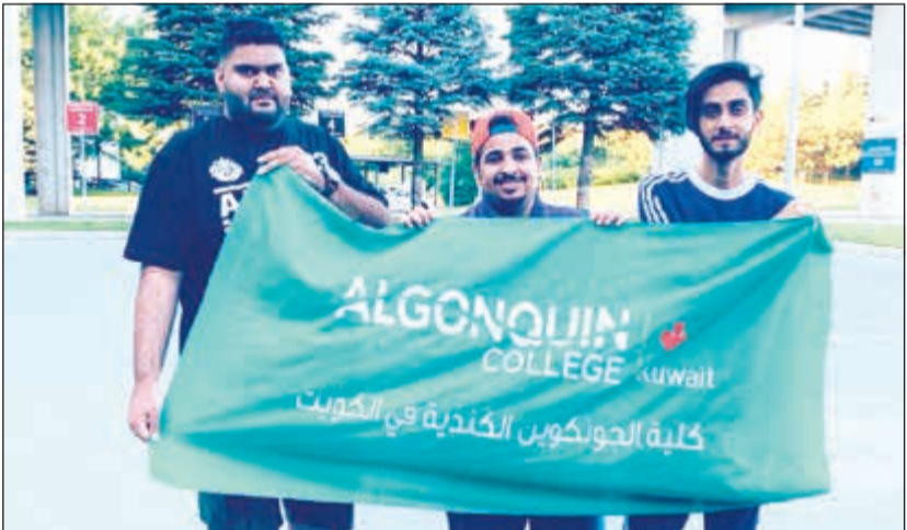
عدد من الطلبة المشاركين بـ «برنامج السفير»