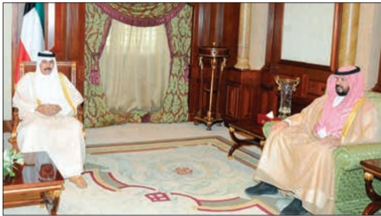
سمو ولي العهد مستقبلاً الشيخ طلال الخالد