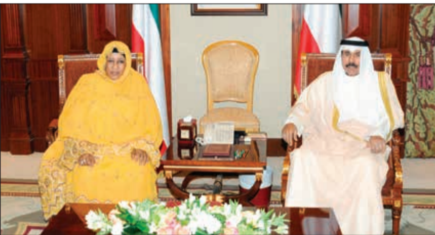
سمو ولي العهد خلال استقباله سفيرة تشاد

واستقبل سمو ولي العهد بقصر بيان صباح امس سفيرة جمهورية باكستان الإسلامية الصديقة لدى الكويت السفيرة غلام دستجير وذلك بمناسبة انتهاء مهام عمله سفيرا لبلادها. حضر المقابلات رئيس المراسم والتشريفات بديوان سمو ولي العهد الشيخ مبارك صباح السالم.