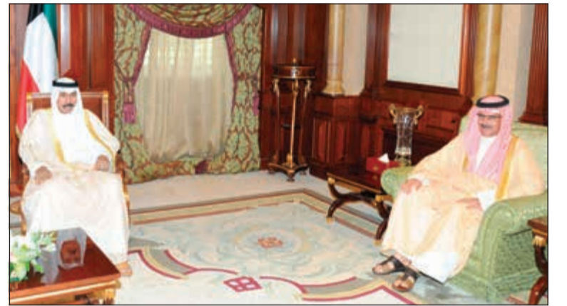
سمو ولي العهد الشيخ نواف الأحمد مستقبلاً الشيخ مبارك الديع

السفير دورجا براساد بهاندري وذلك بمناسبة توليه مهام منصبه الجديد سفيرا لبلادها. كما استقبل سمو ولي العهد سفيرة جمهورية تشاد الصديقة لدى الكويت السفيرة البتول زكريا وذلك بمناسبة توليها مهام منصبها الجديد سفيرة لبلادها.