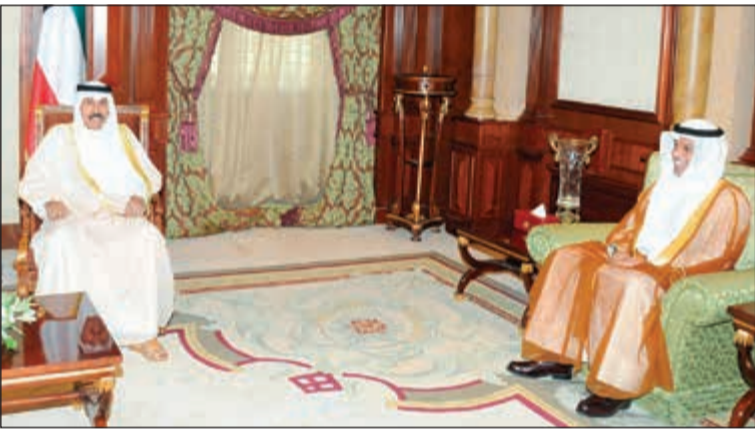
سمو ولي العهد الشيخ نواف الأحمد مستقبلاً السفير حمد الهزيم