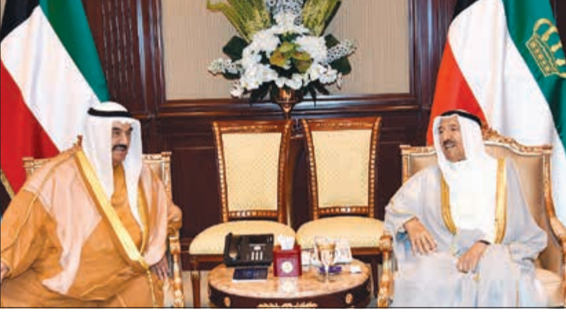
صاحب السمو الأمير الشيخ صباح الأحمد مستقبلاً سمو الشيخ ناصر المحمد

اليابان، عبر فيها سموه عن خالص تعازيه وصادق مواساته بوفاة يوكيا أمانو المدير العام للوكالة الدولية للطاقة الذرية، مشيداً سموه بجهوده الكبيرة لتطوير أنشطة الوكالة الدولية للطاقة الذرية الرامية لتحقيق الأمن والسلام الدوليين ومنع انتشار الأسلحة النووية وتطوير الطاقة السلمية راجياً لذويه ولأسرته جميل الصبر. وبعث سمو ولي العهد الشيخ نواف الأحمد ببرقية تعزية إلى شينزو أبي رئيس وزراء اليابان، ضمنها سموه خالص تعازيه وصادق مواساته بوفاة سعادة يوكيا أمانو المدير العام للوكالة الدولية للطاقة الذرية. كما بعث سمو رئيس مجلس الوزراء الشيخ جابر المبارك ببرقية تعزية مماثلة.