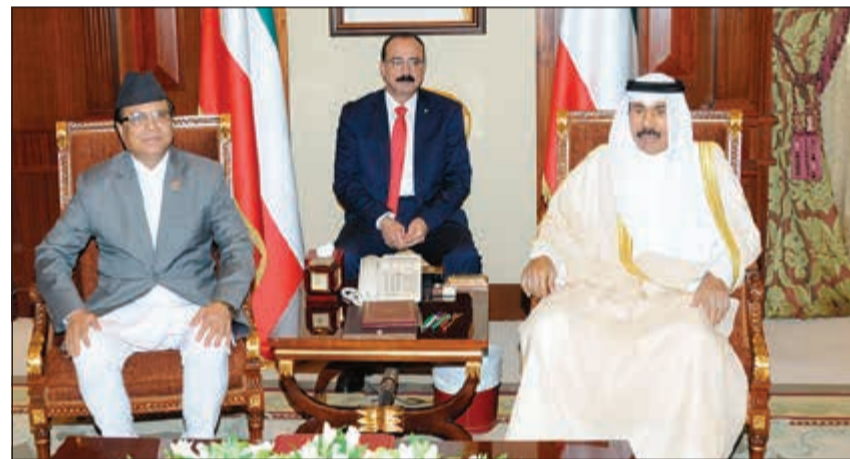
سمو ولي العهد مستقبلاً سفير نيبال

إلى ذلك استقبل سمو ولي العهد الشيخ نواف الأحمد بقصر بيان صباح امس سفيرة جمهورية باكستان الإسلامية الصديقة لدى الكويت السفيرة غلام دستجير وذلك بمناسبة انتهاء مهام عمله سفيرا لبلادها.