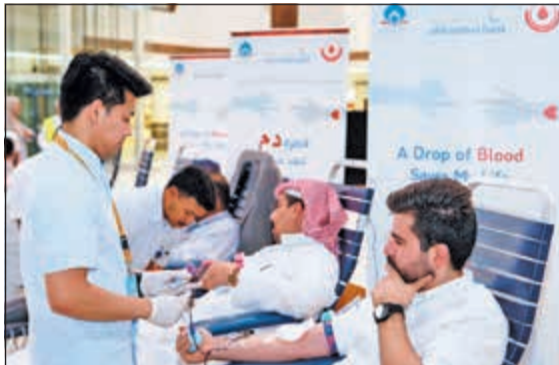
موظفو البنك يتبرعون بالدم

و(من أحيانا فكاننا أحياء الناس جميعا)، حيث قامت «المنابر القرآنية» بالتعاون مع البنك الأهلي المتحد وبنك الدم المركزي في وزارة الصحة بإطلاق حملة التبرع بالدم الأولى تحت شعار «قطرة دم.. تنقذ حياتي»، وقد لاقت حضورا ومشاركة من العديد من أطباء المجتمع صغارا وكبارا، رجالا ونساء، مؤكداً أن هذا التفاعل يؤكد حب هذا الشعب للبدل والعطاء وتقديم الخير والإحسان إلى الغير. وأوضح العنزي أن هذه المبادرة الإنسانية تأتي من منطلق حرص «المنابر القرآنية» على ترسيخ القيم القرآنية والنبوية، مبيّنا أن هذا النوع من الحملات يعد مظهرا من مظاهر التضامن في المجتمع الذي يهتم أفرادها بعضهم ببعض، من منطلق قوله ﷺ «مثل المؤمن في توادم وتراحمهم وتعاطفهم كمثل الجسد الواحد إذا اشتكى منه عضو تداعى له سائر الأعضاء بالحمي والسهير»، لافتا إلى الأخرين الذين هم في أمس الحاجة لنقل الدم.