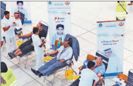
إقبال كبير من موظفي البنك على التبرع بالدم