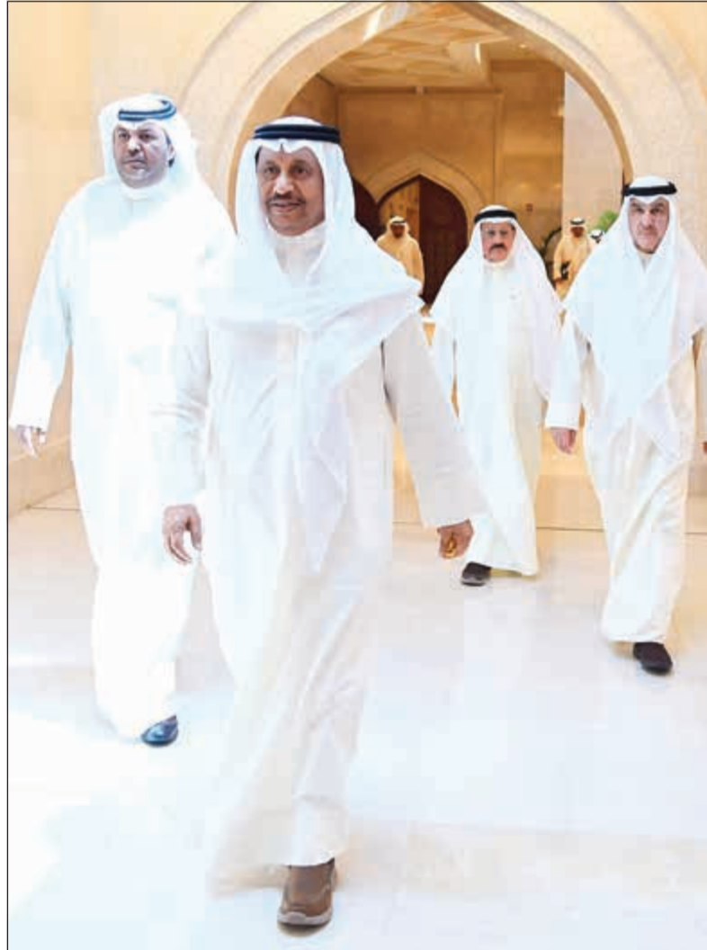
سمو الشيخ جابر المبارك في طريقه لتروؤ الاجتماع الأسبوعي لمجلس الوزراء

أكد الوكيل المساعد لشؤون الرقابة الدوائية والغذائية بوزارة الصحة د.عبدالله البدر سلامة المكمل الغذائي الخاص بـ «التخسيس»، والذي أشيع أنه يسببه حدثت حالة وفاة، وذلك بعد إجراء الفحوصات المخبرية، لافتاً إلى أنه يتم حالياً إجراء فحوصات لمعرفة مدى خلو المنتج من «المكروبات» من عدمه. من جانب آخر، أكد مصدر مطلع أن وزير الصحة الشيخ د.باسل الصباح أبلغ جميع رؤساء الأقسام الطبية بضرورة استخدام النموذج الجديد للجان العلاج في الخارج مع كتابة رقم المرجع وعدم ذكر بلد العلاج. وقال المصدر لـ «الأنباء»