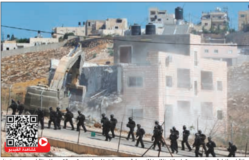
جرافة إسرائيلية ويعاصر من قوات الاحتلال خلال عملية هدم منازل فلسطينيين قرب القدس المحتلة اس

بفتح تحقيق فوري في جرائم الاحتلال، فيما قرر الرئيس محمود عباس البدء بوضع آليات «لإلغاء كل الاتفاقيات مع إسرائيل، كما أوعز لممثل فلسطين في الأمم المتحدة بطلب جلسة عاجلة لمجلس الأمن لبحث هذا التصعيد الخطير. التفاصيل ص 19