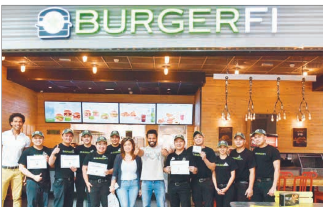
العمالون المكرمون بعد تدريبهم في الولايات المتحدة

النجاح المطلوب ما لم تكن العمالة الموجودة بها مدربة جيداً على إعداد هذه الوجبات ومدركة تماماً لدى النظافة المطلوبة، حيث توفر مطاعم بيرغر فاي فرص عمل متنوعة للشباب مع الحرص على تدريبهم على أعلى مستوى.