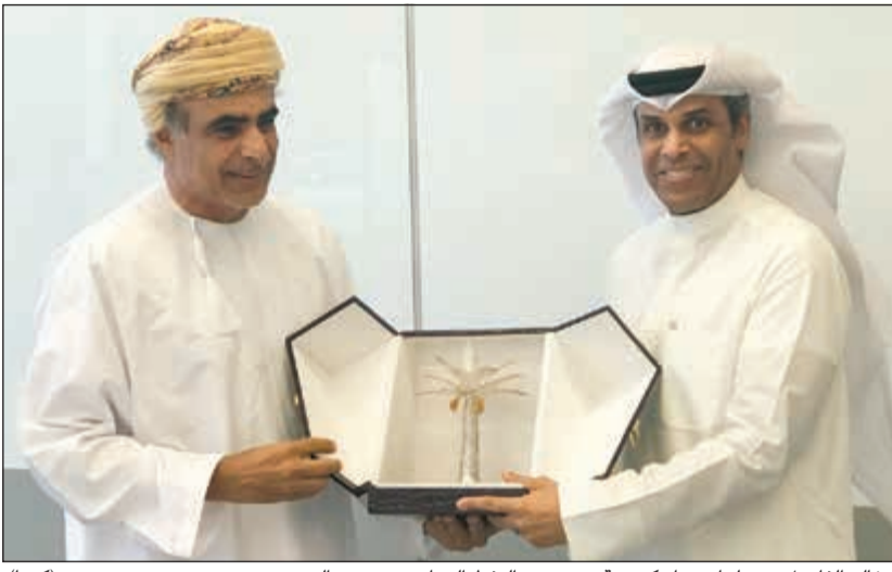
د.خالد الفاصل متسلما درعا تكريمية من وزير النفط العماني د.محمد الرمحي

أداء مصفاة الدقم متميز وسابق للنسب المتوقعة