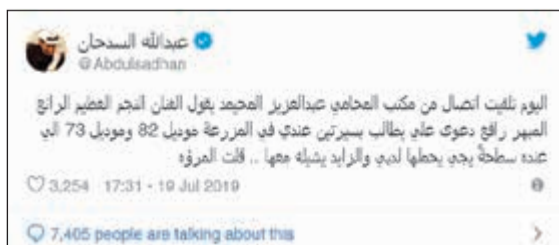
تغريدة عبدالله السدحان على «تويتر»

وكان من المفترض أن الخلاف بين كلا الفنانين السعوديين ناصر القسبي وعبدالله السدحان الذي دام حوالي 4 سنوات قد انتهى، وفور إعلان تركي آل الشيخ رئيس هيئة الترفيه السعودية عن عمل جديد يجمع بينهما، عبر قناة «أم بي سي»، وطالب الشيخ كلا من القسبي والسدحان بالمشاركة في عمل واحد، أثناء حضورهما المؤتمر الصحافي للإعلان عن مشاريع الهيئة الترفيهية السعودية خلال العام الحالي، ولم يعترض أي من الطرفين على فكرة المشاركة في عمل واحد من جديد، خاصة بعد تصفيق وترحيب جميع النجوم الحاضرين لهذا المؤتمر.